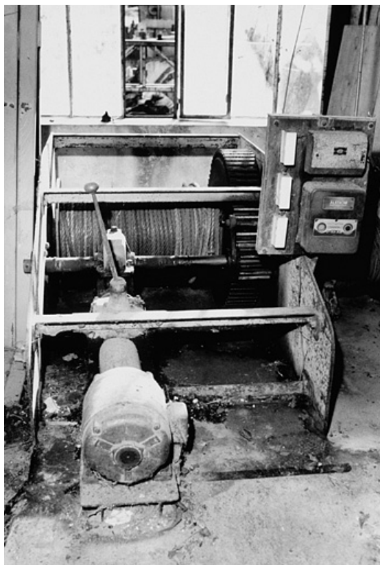
Moteur, boîte de vitesse et tambour.

39, Saint-Amour, 2 à 6 rue de la Marbrerie