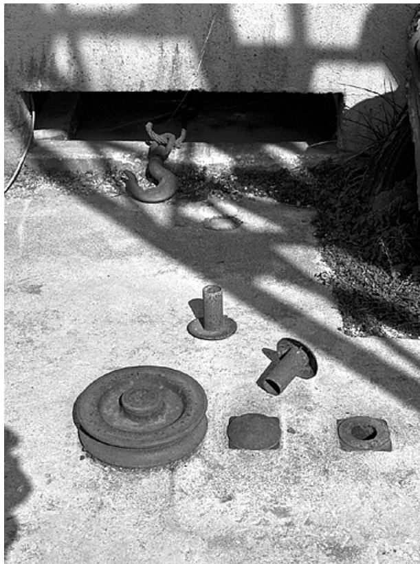
Poulie de renvoi d'angle.

39, Saint-Amour, 2 à 6 rue de la Marbrerie