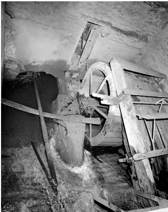
Roue hydraulique verticale.

39, Saint-Amour, 2 à 6 rue de la Marbrerie