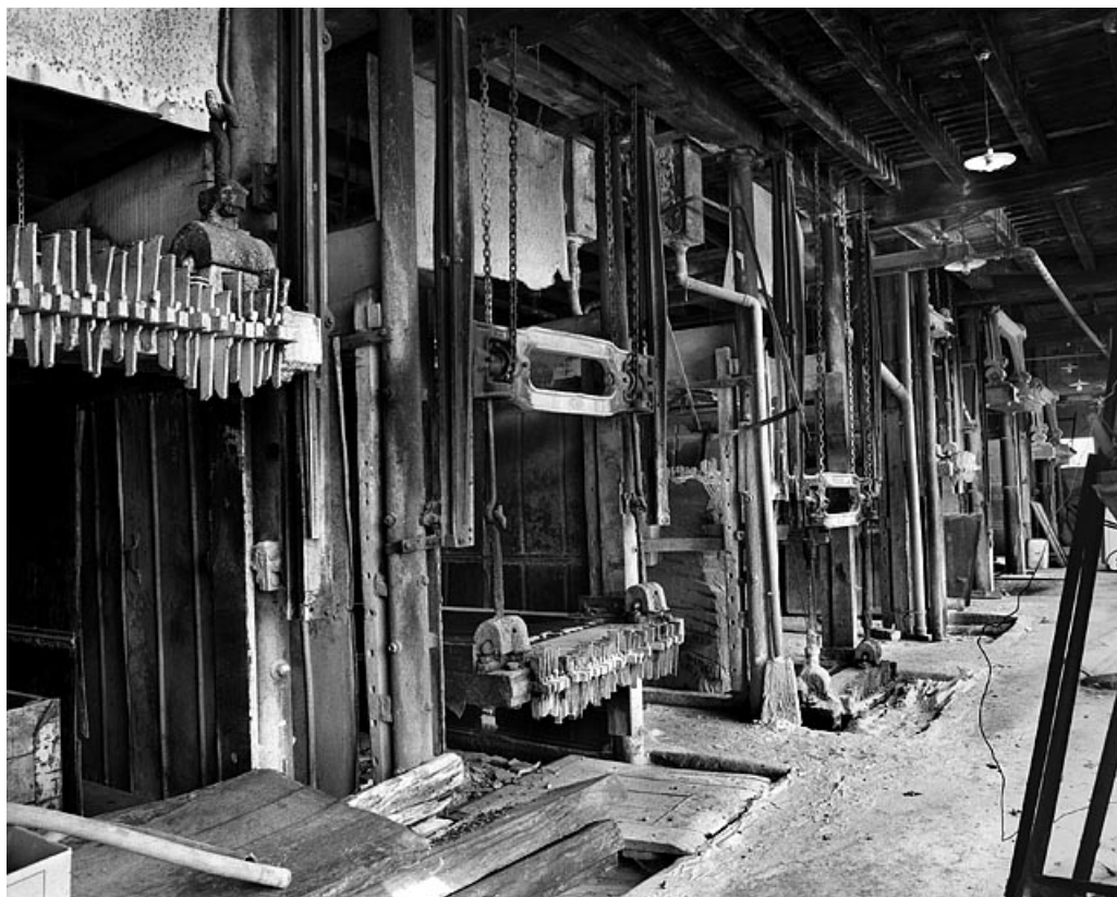
Vue d'ensemble des châssis multilames.