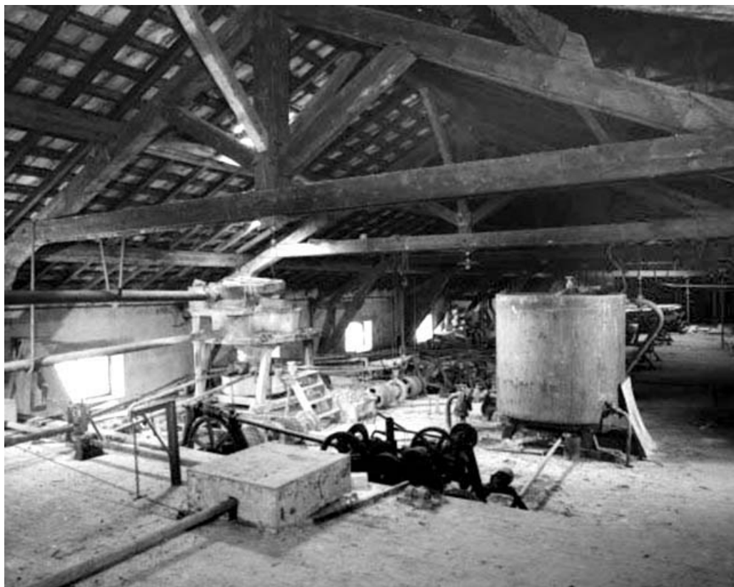
Cuve, système de distribution de la noria et systèmes de descente des châssis multilames dans le comble. 39, Saint-Amour, 2 à 6 rue de la Marbrerie