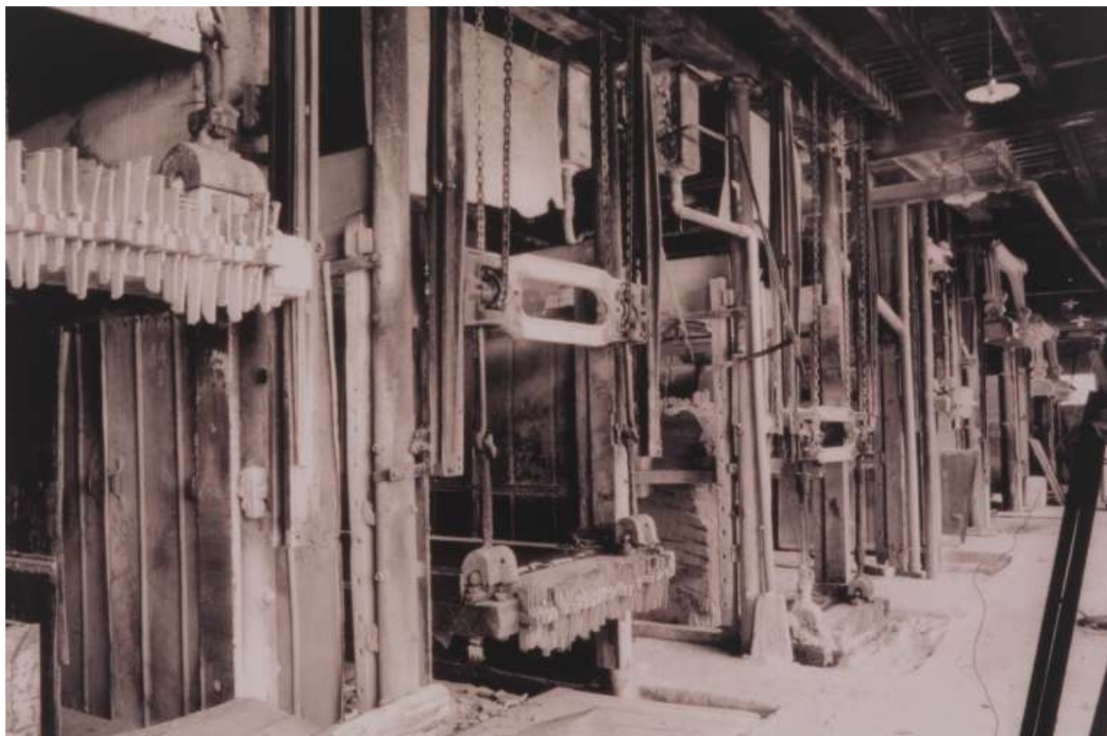
Vue d'ensemble des châssis multilames.

39, Saint-Amour, 2 à 6 rue de la Marbrerie