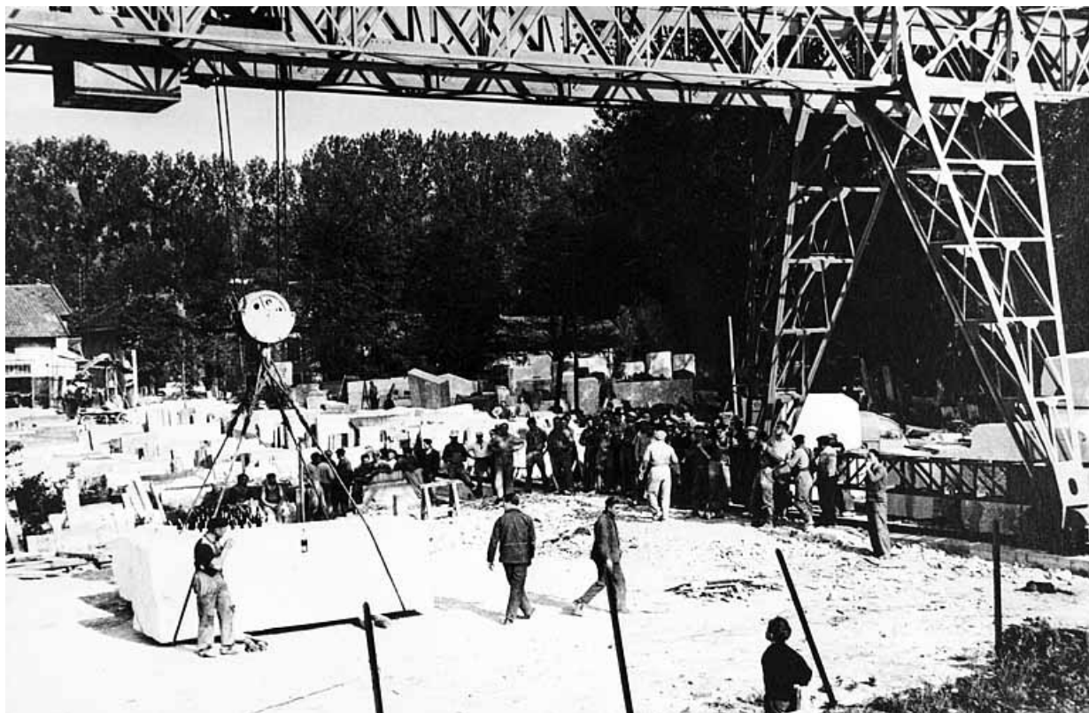
Vue d'ensemble le jour de l'inauguration. 39, Saint-Amour, 2 à 6 rue de la Marbrerie