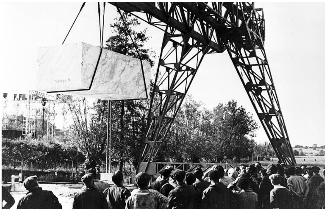
Inauguration : essai de résistance avec un bloc de marbre de 30 tonnes.

39, Saint-Amour, 2 à 6 rue de la Marbrerie