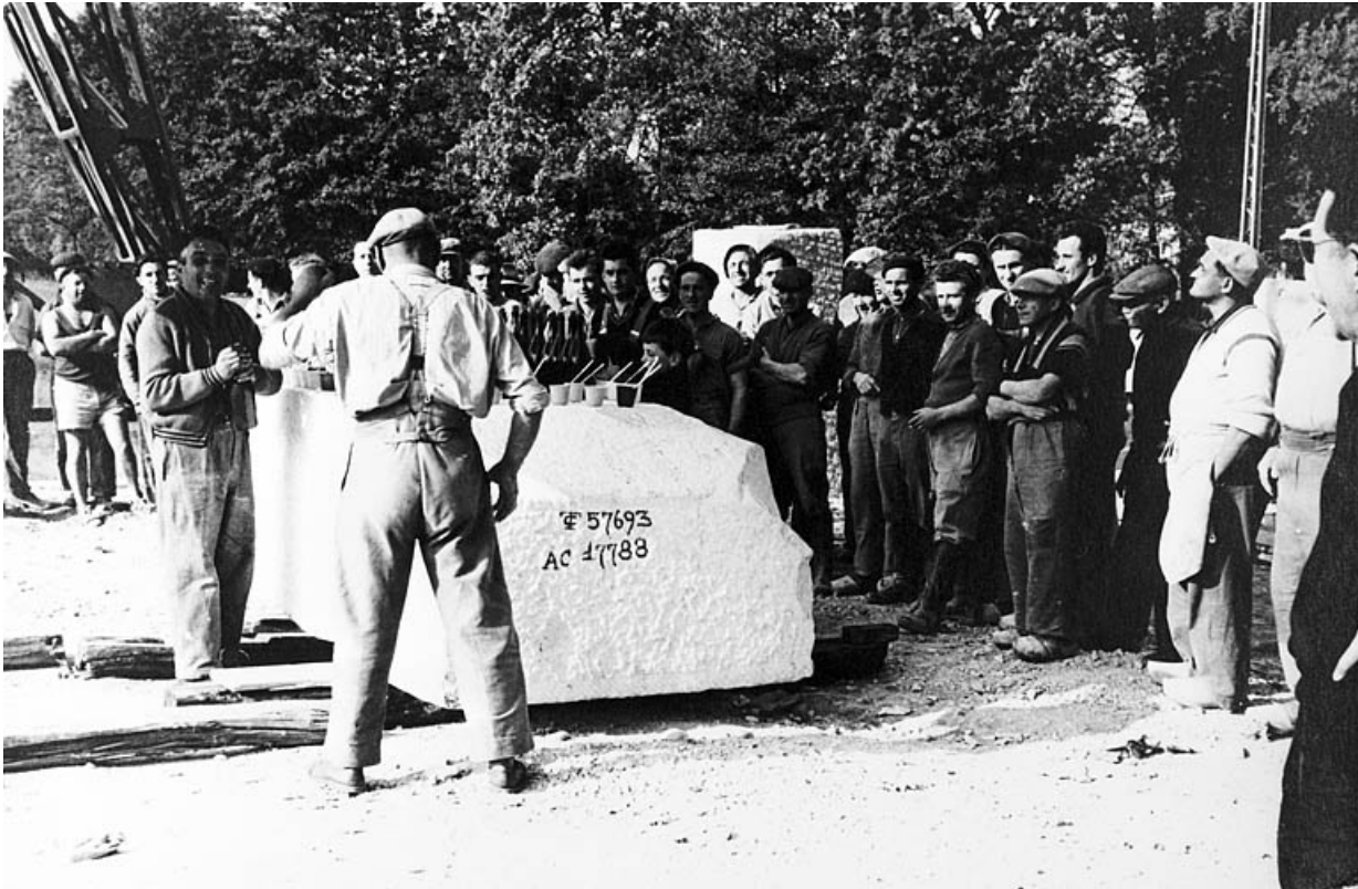
Personnel réuni le jour de l'inauguration.

39, Saint-Amour, 2 à 6 rue de la Marbrerie