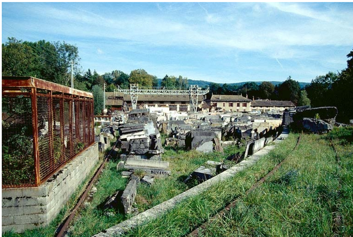
Vue d'ensemble de l'aire des matières premières et du portique roulant. Voie de roulement à gauche, voie ferrée à droite. 39, Saint-Amour, 2 à 6 rue de la Marbrerie