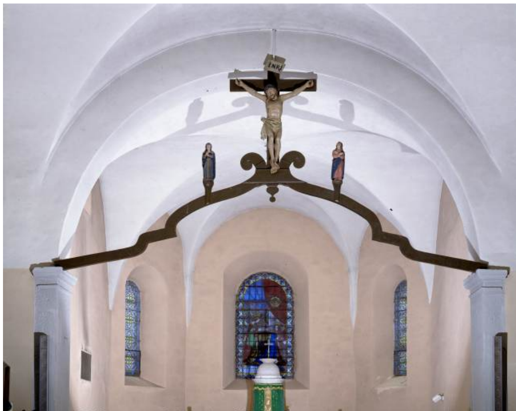
Vue d'ensemble. 39, Les Bouchoux