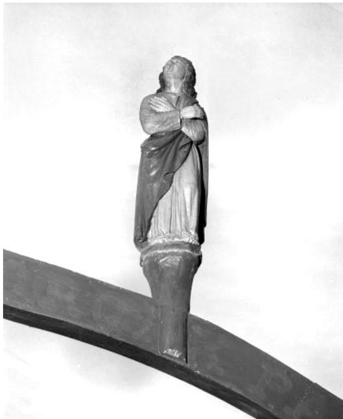
Détail : saint Jean l'évangéliste.