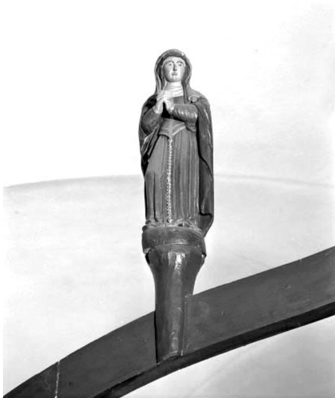
Détail : la Vierge.