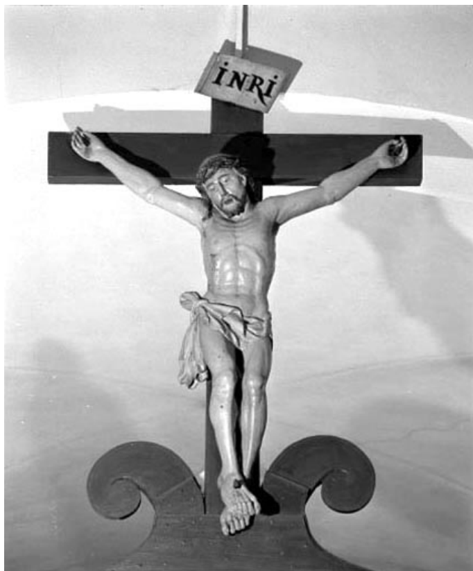
Détail : le Christ en croix.