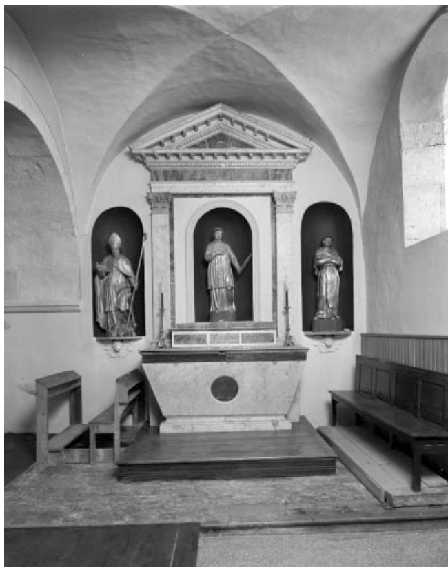
L'autel latéral sud.