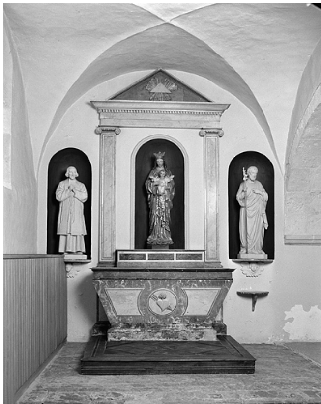
L'autel latéral nord.