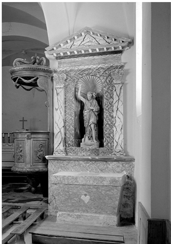
Vue d'ensemble de l'autel latéral sud.