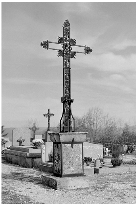
Vue du revers.