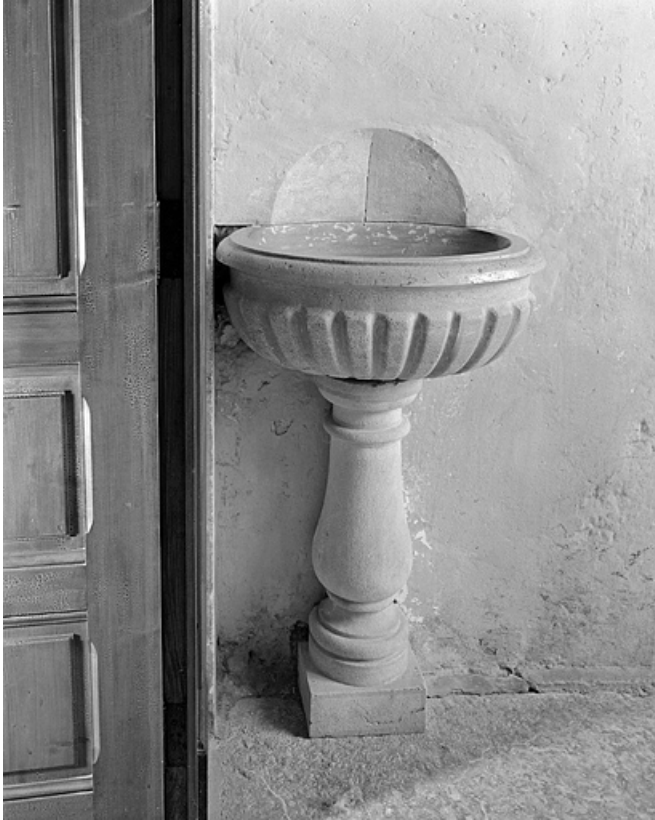
Vue générale d'un bénitier.