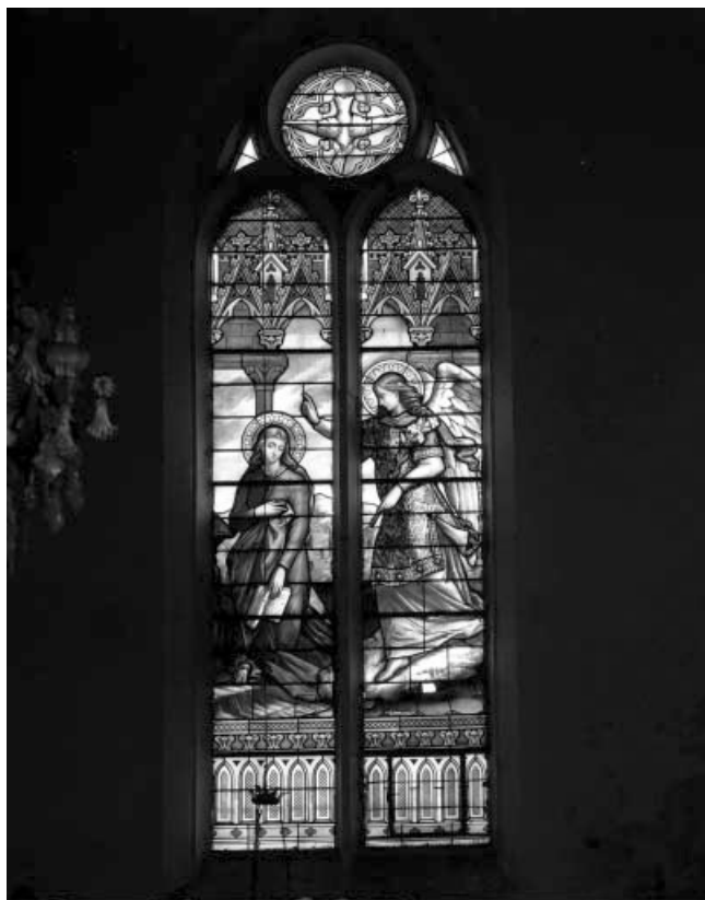
Baie 6 : Annonciation, vue générale.