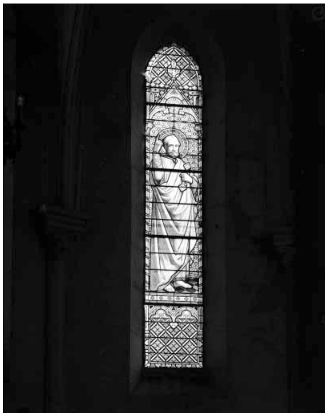
Baie 1 : saint Pierre.