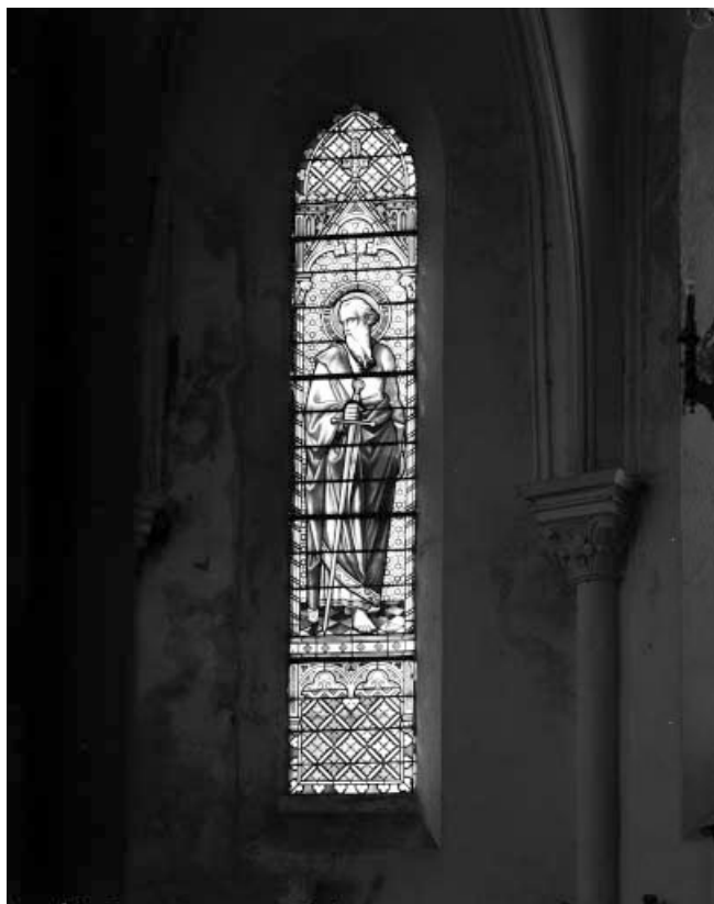
Baie 2 : saint Paul.