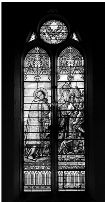
Baie 5 : saint Laurent est ordonné diacre, vue générale. 39, Choux