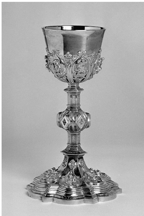
Vue générale du calice.