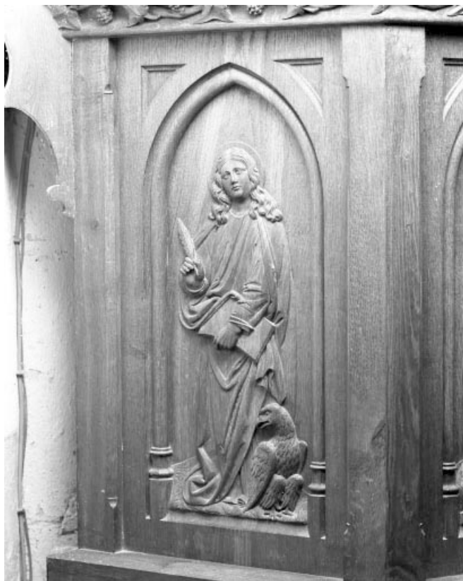
Premier panneau de la cuve : saint Jean l'évangéliste. 39, Choux