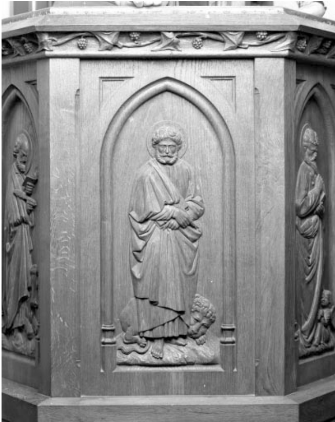
Troisième panneau de la cuve : saint Marc. 39, Choux