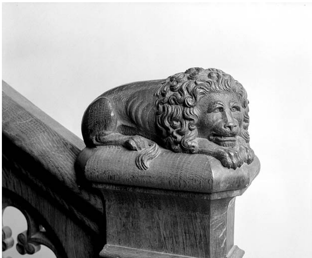
Le lion sur le départ de la rampe.