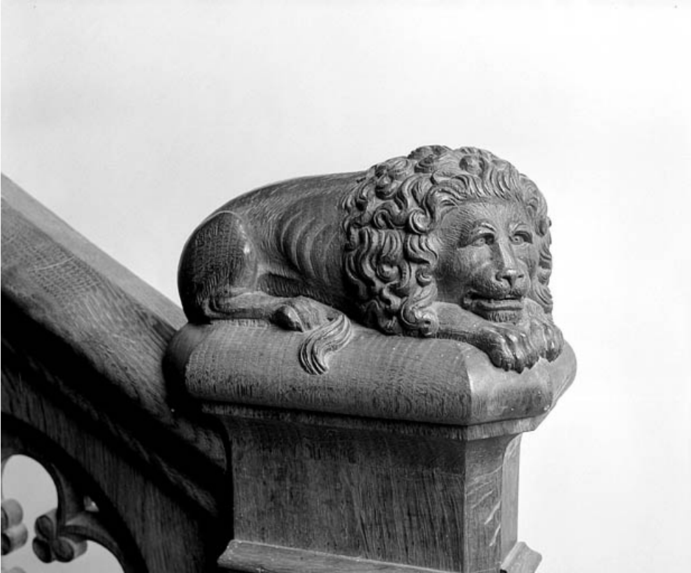
Le lion sur le départ de la rampe.