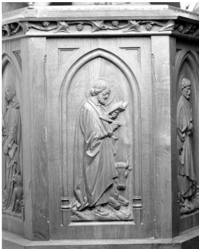
Deuxième panneau de la cuve : saint Luc. 39, Choux