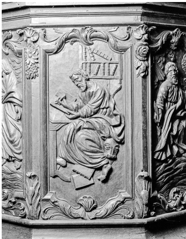
4e panneau de la cuve : saint Luc.