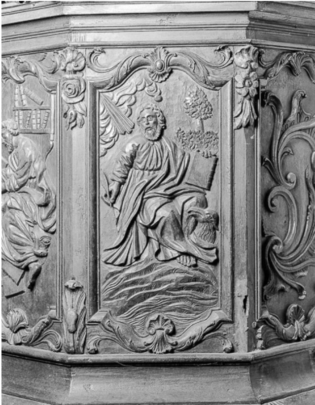
5e panneau de la cuve : saint Jean.