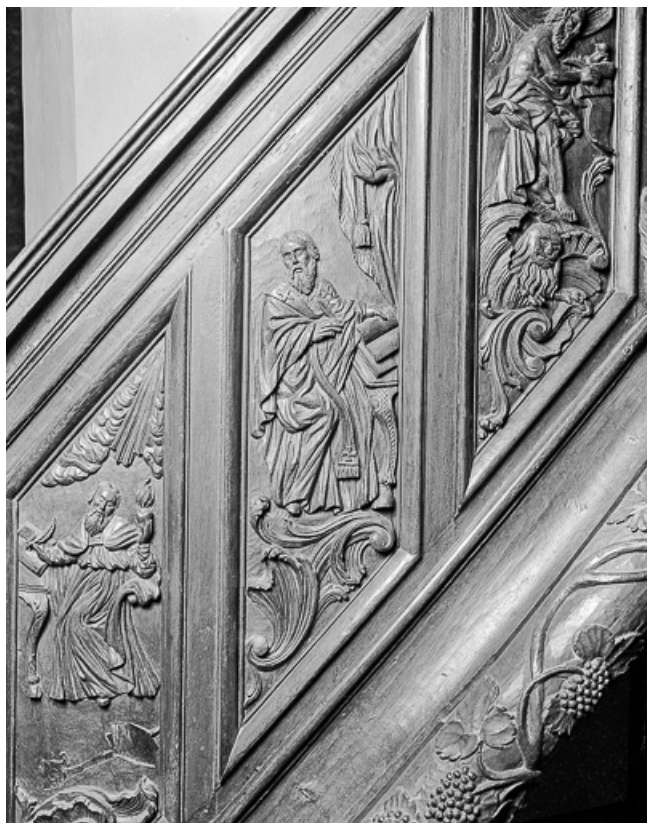
3e panneau de la rampe : saint Amboise.