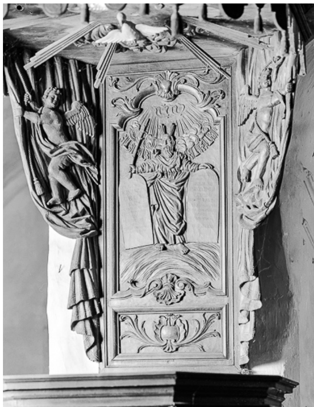
Le dorsal : Moïse.