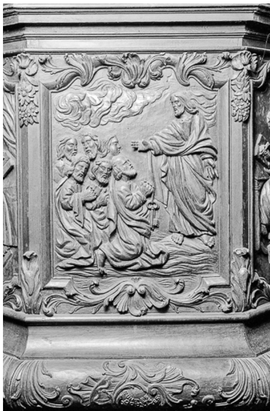
3e panneau de la cuve : la tradition des clefs à saint Pierre.