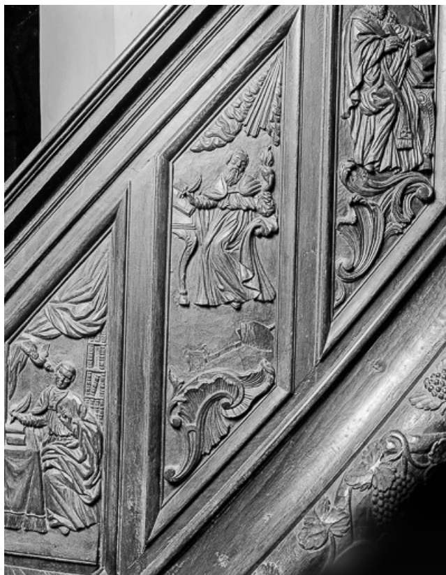
2e panneau de la rampe : saint Augustin.