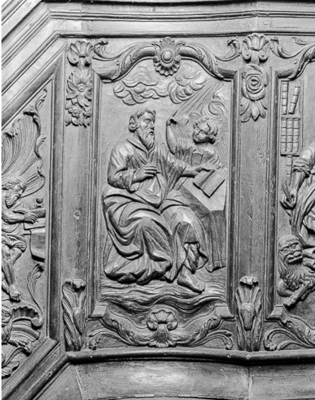
1er panneau de la cuve : saint Matthieu.