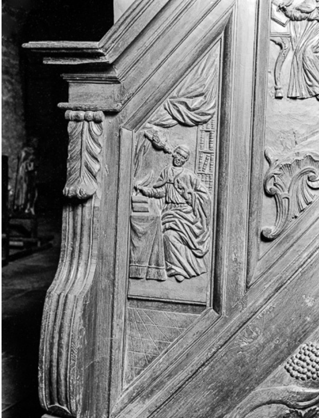
1er panneau de la rampe : saint Grégoire le Grand. 39, Saint-Maur