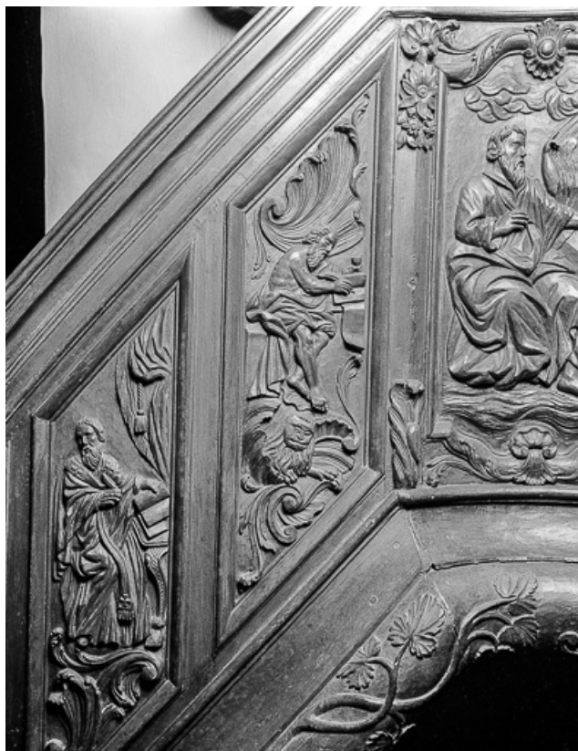
4e panneau de la rampe : saint Jérôme 39, Saint-Maur