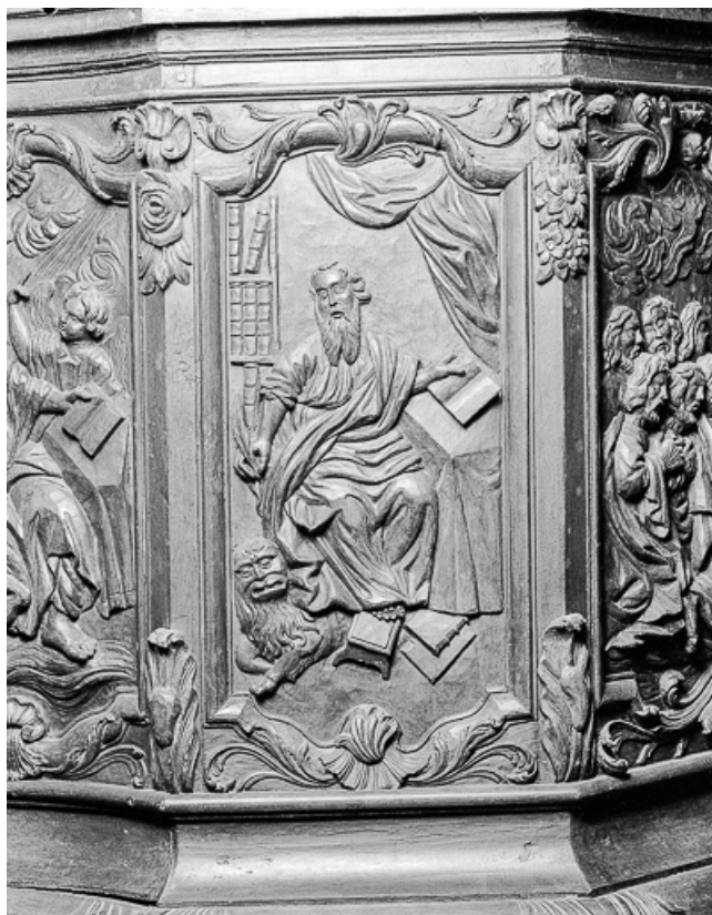
2e panneau de la cuve : saint Marc.