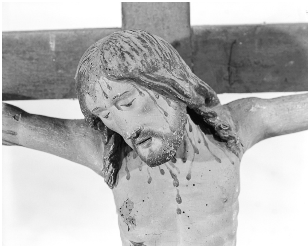
Détail : la tête du Christ.