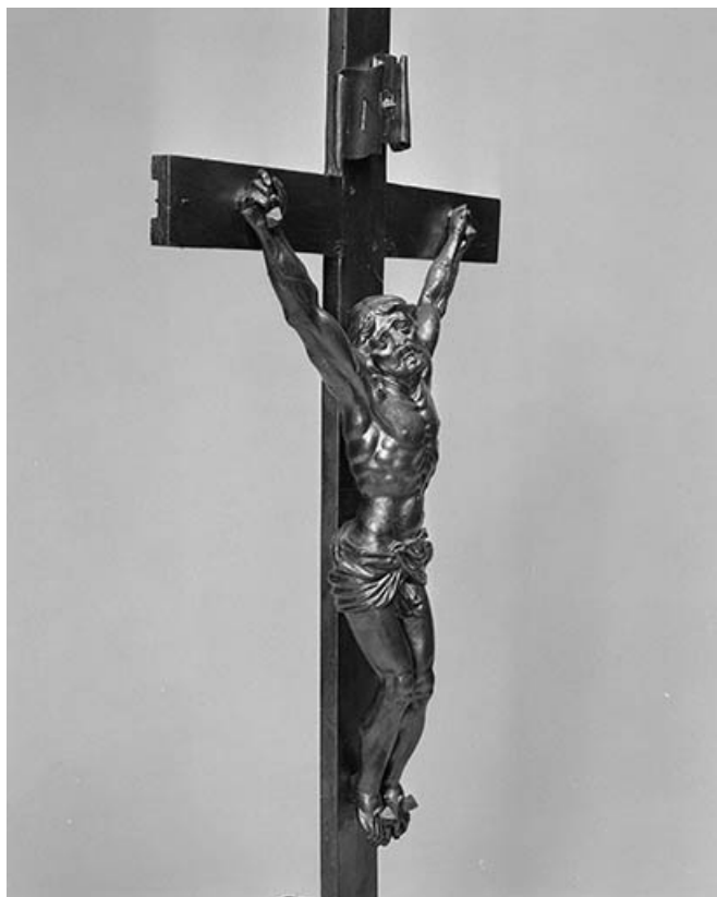
Vue de trois quarts.