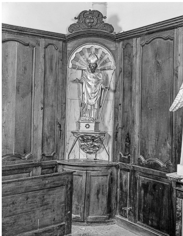
Vue de face, dans sa niche.