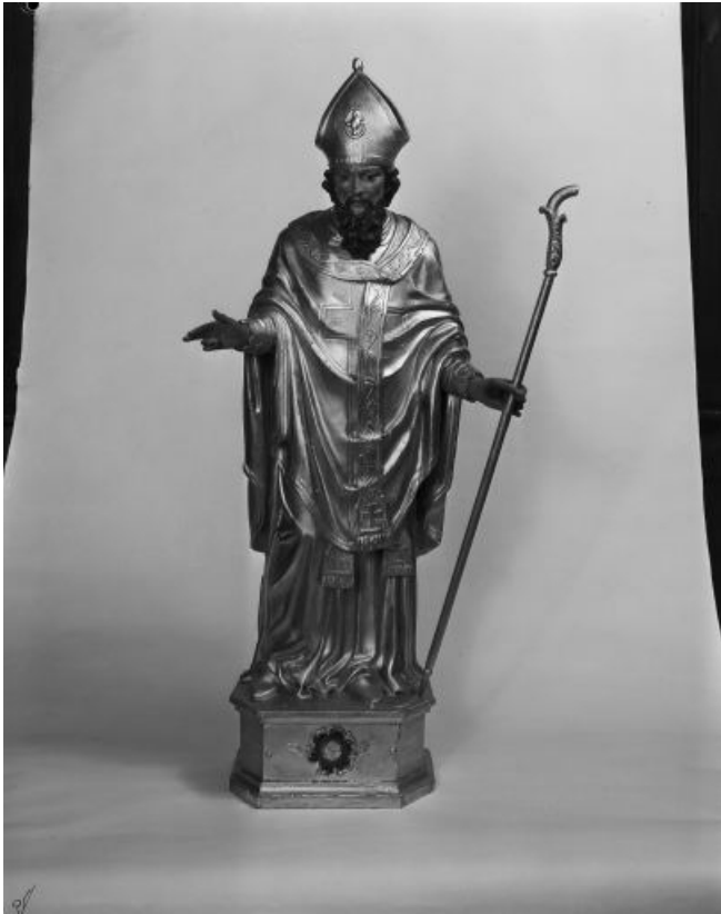
Vue de face.