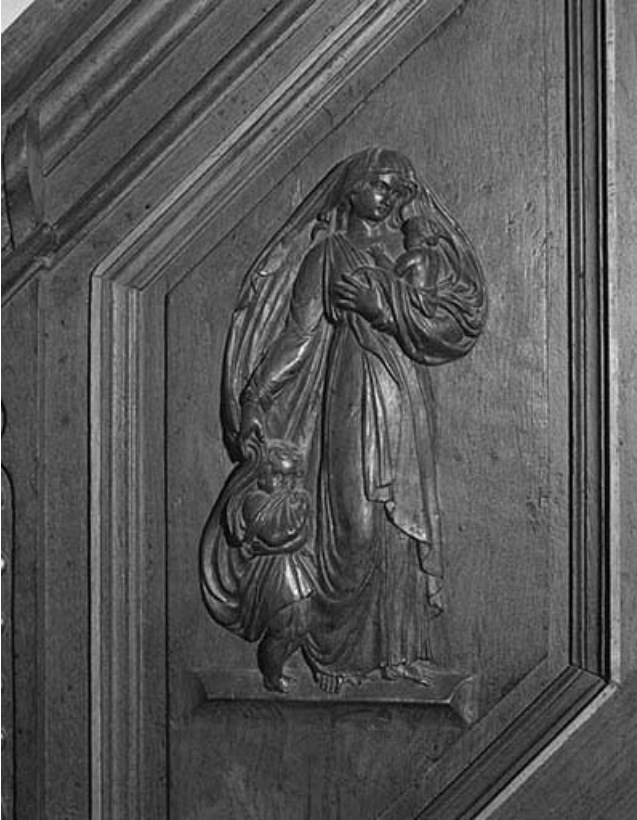
2e panneau de la rampe : la Charité.