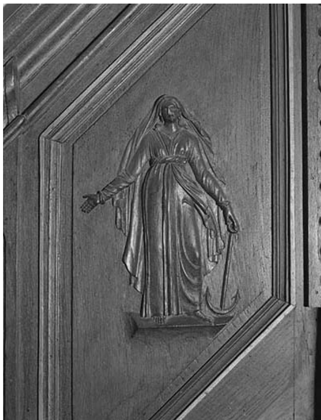
3e panneau de la rampe : l'Espérance. 39, Montaigu