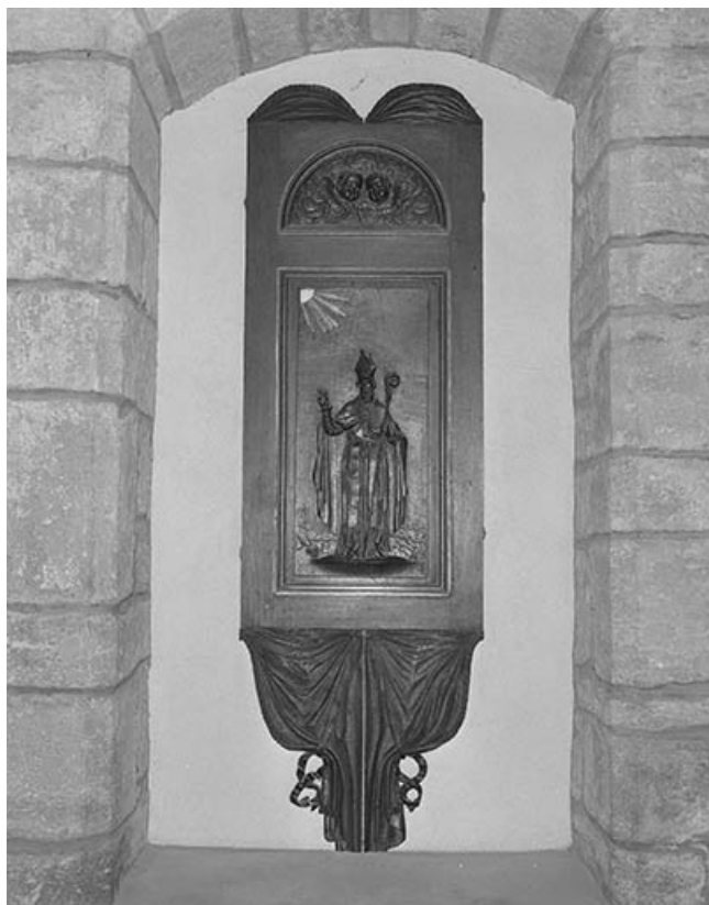
Le dorsal. 39, Montaigu