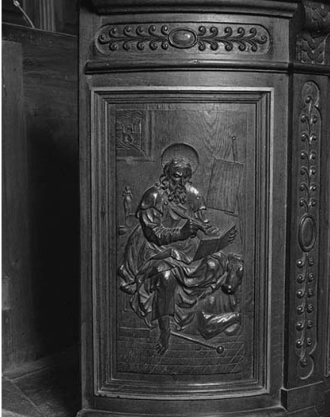
1er panneau de la cuve : saint Luc.