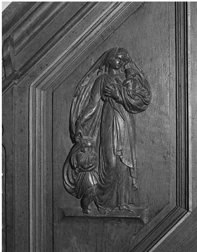
2e panneau de la rampe : la Charité. 39, Montaigu