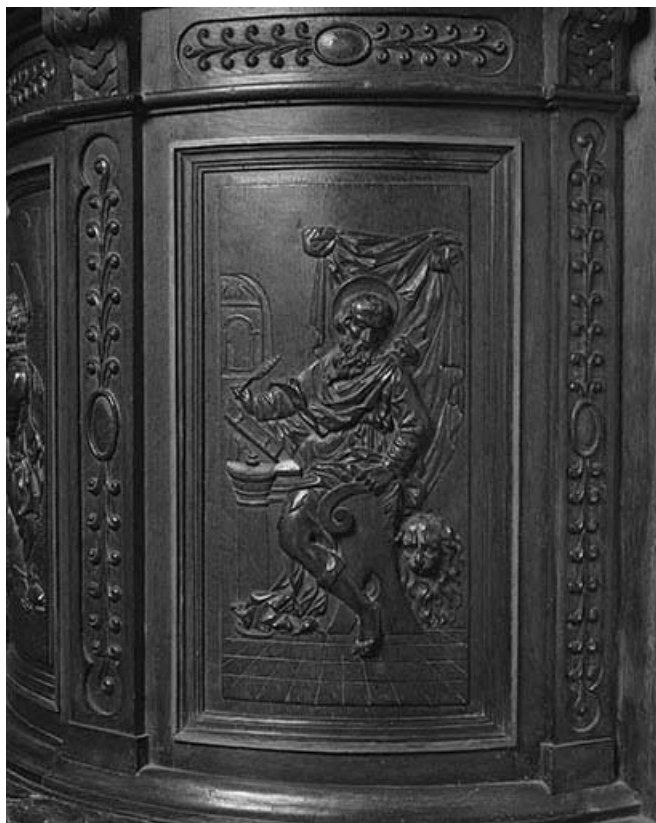
4e panneau de la cuve : saint Marc.