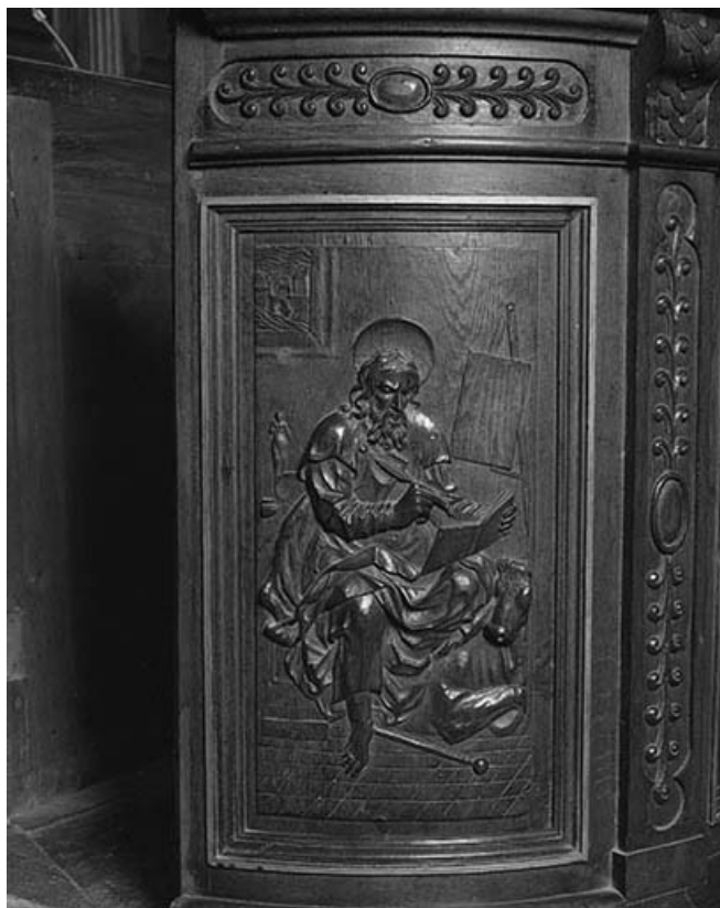
1er panneau de la cuve : saint Luc.