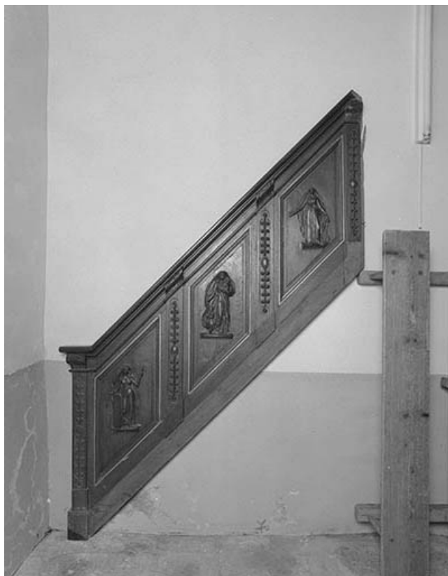
La rampe. 39, Montaigu