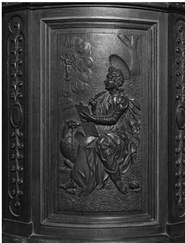
3e panneau de la cuve : saint Jean.