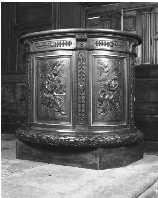
Vue d'ensemble de la cuve.