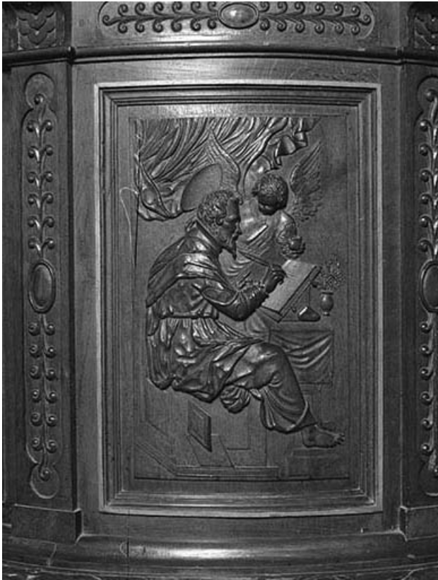
2e panneau de la cuve : saint Matthieu. 39, Montaigu