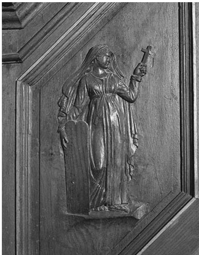
1er panneau de la rampe : la Foi.