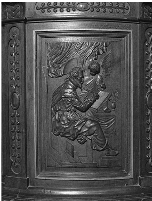
2e panneau de la cuve : saint Matthieu. 39, Montaigu