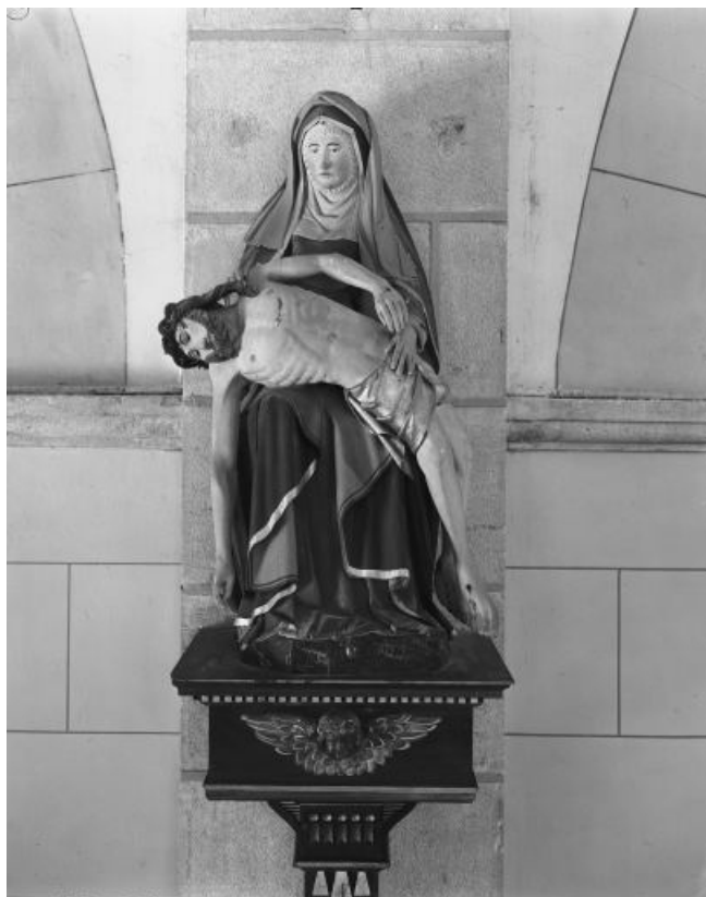
Vue d'ensemble. 39, Conliège Haute