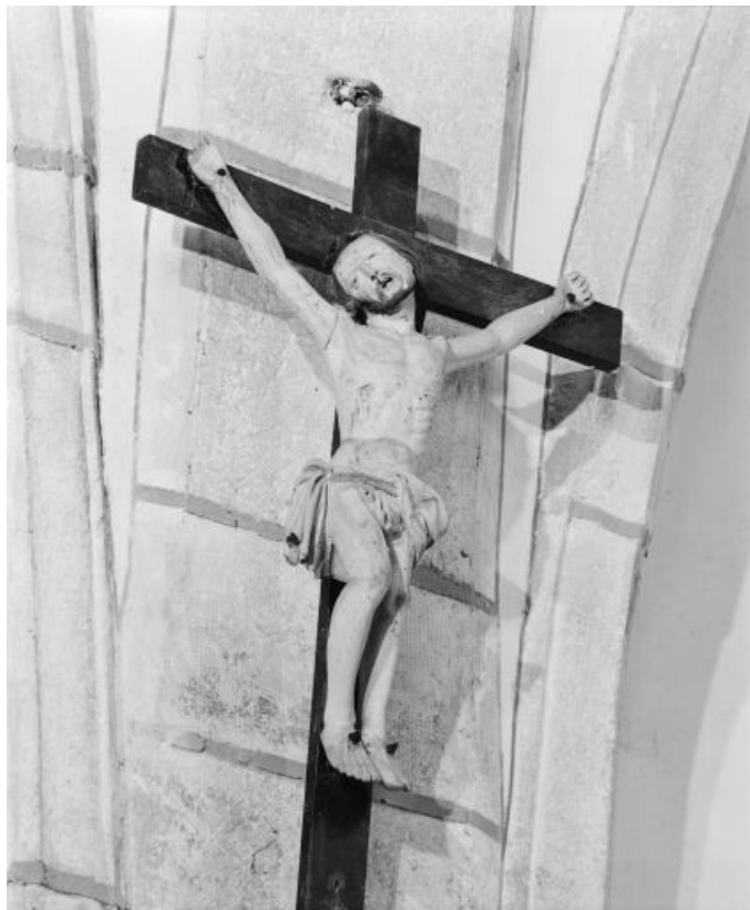
Vue d'ensemble. 39, Conliège Haute