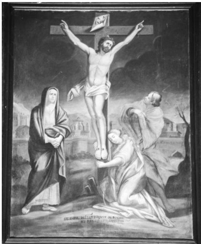
Vue d'ensemble. 39, Conliège Eglise