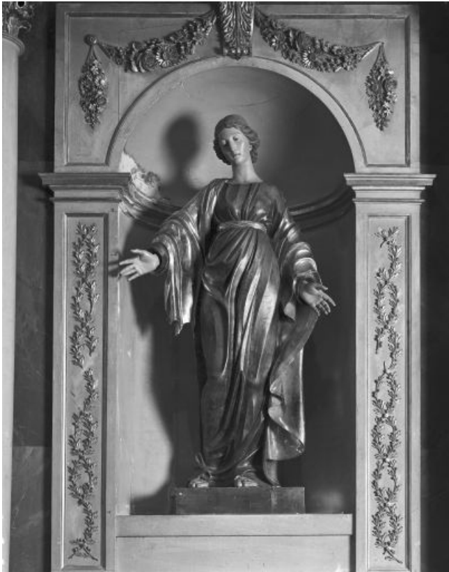
Vue de face.