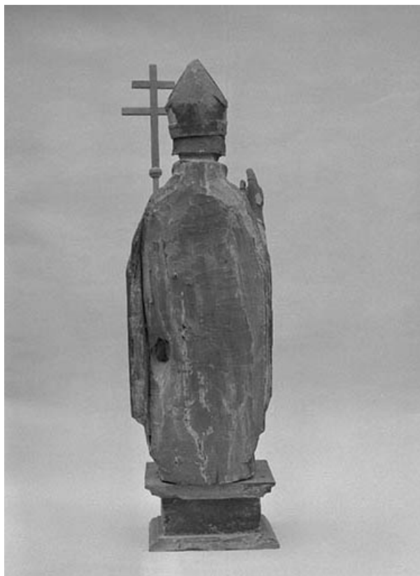
Vue du revers.