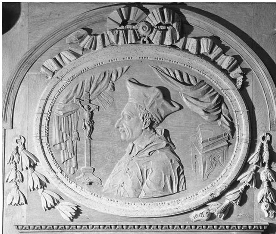
Médaillon de droite du troisième pan de l'abside : un chanoine.