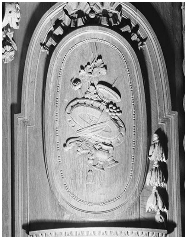
Médaille du panneau arrondi du troisième pan de l'abside. 39, Conliège Eglise