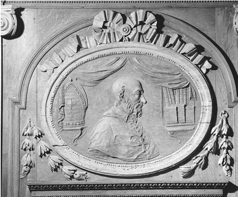
Médaille de gauche du troisième pan de l'abside : un évêque.