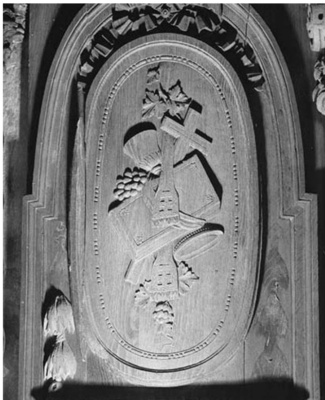
Médaille du panneau arrondi du premier pan de l'abside. 39, Conliège Eglise