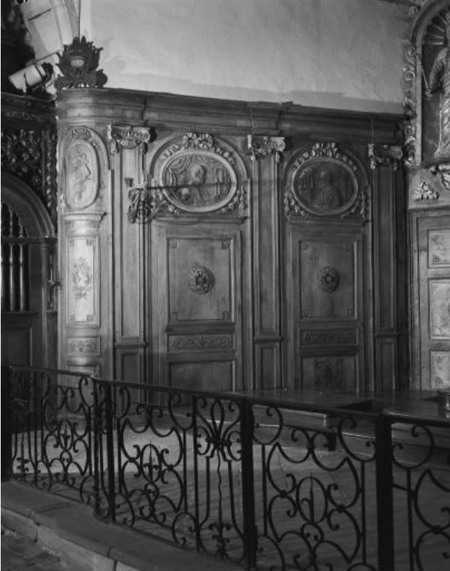
Vue générale du premier pan de l'abside.