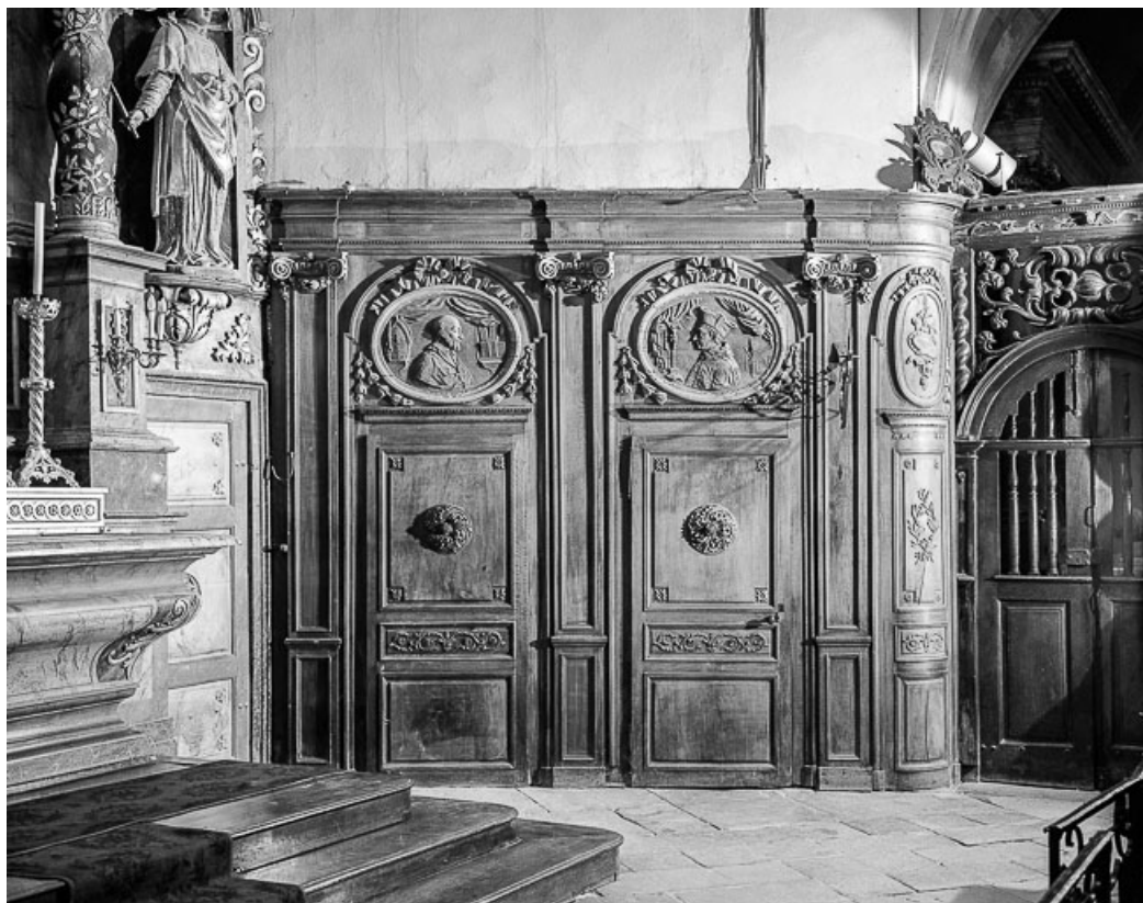
Vue générale du troisième pan de l'abside.