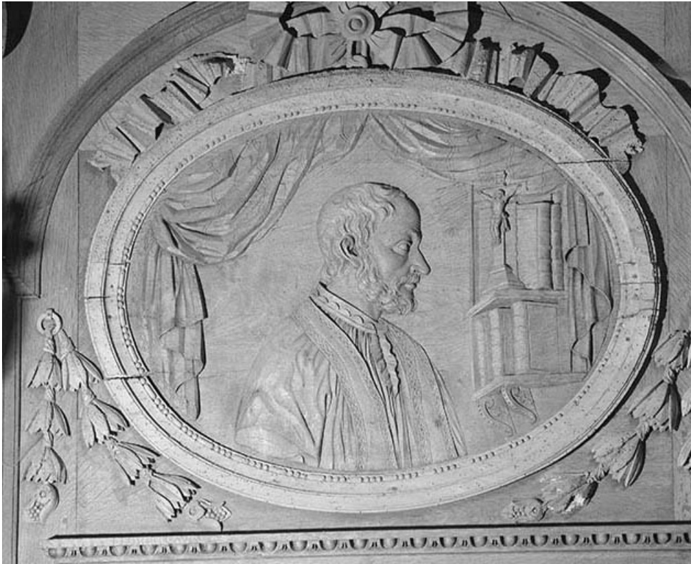
Médailon de gauche du premier pan de l'abside : un prêtre. 39, Conliège Eglise