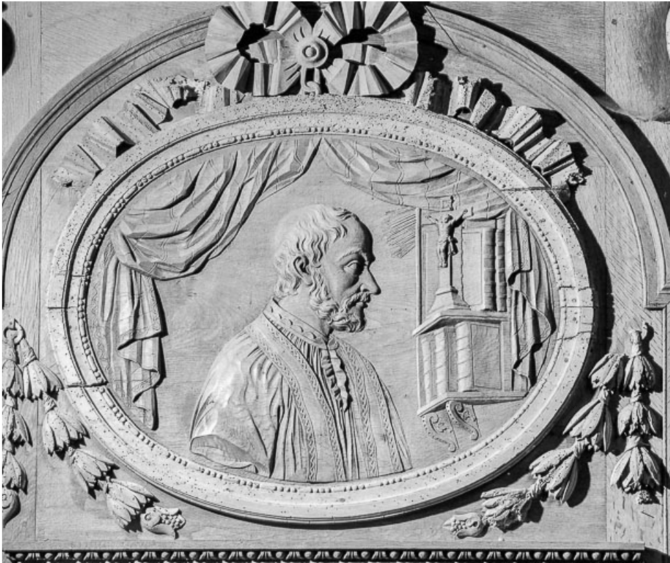
Médaille central du panneau gauche.