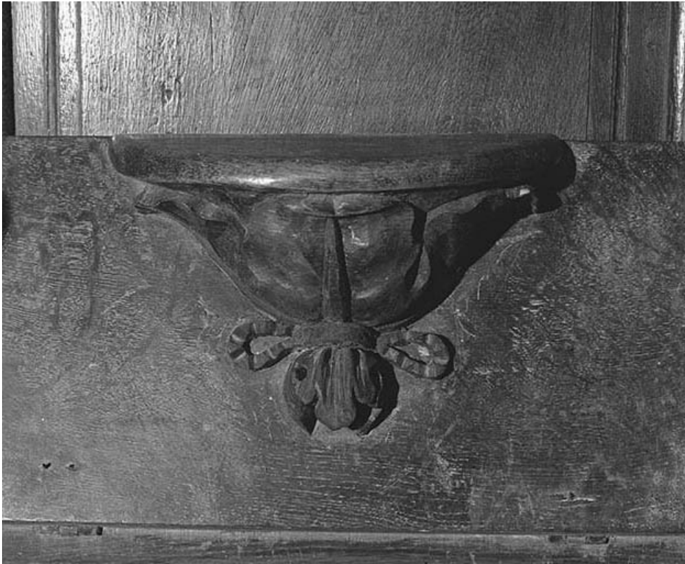
Une miséricorde. 39, Conliège Eglise