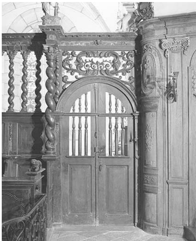
Porte reliant les stalles aux lambris de l'abside.