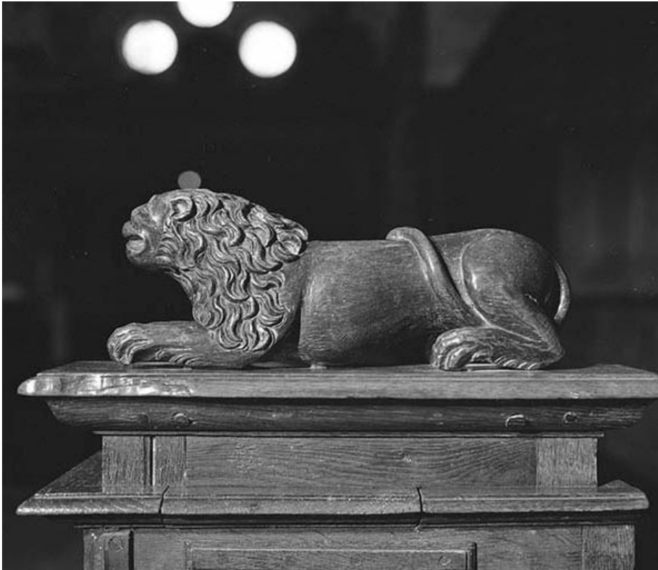
Lion sur une jouée des stalles basses.