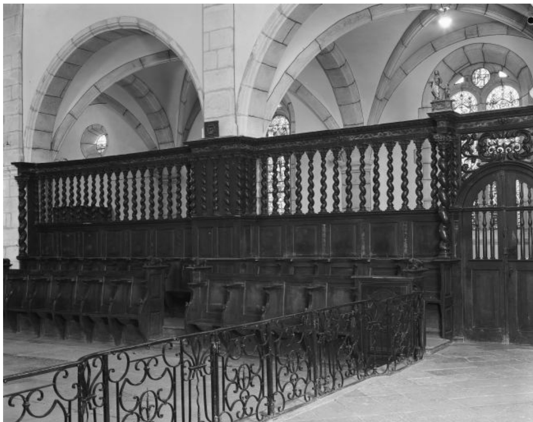
Vue générale des stalles de gauche depuis le chœur.