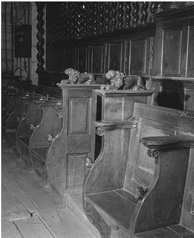
Détail des stalles basses.