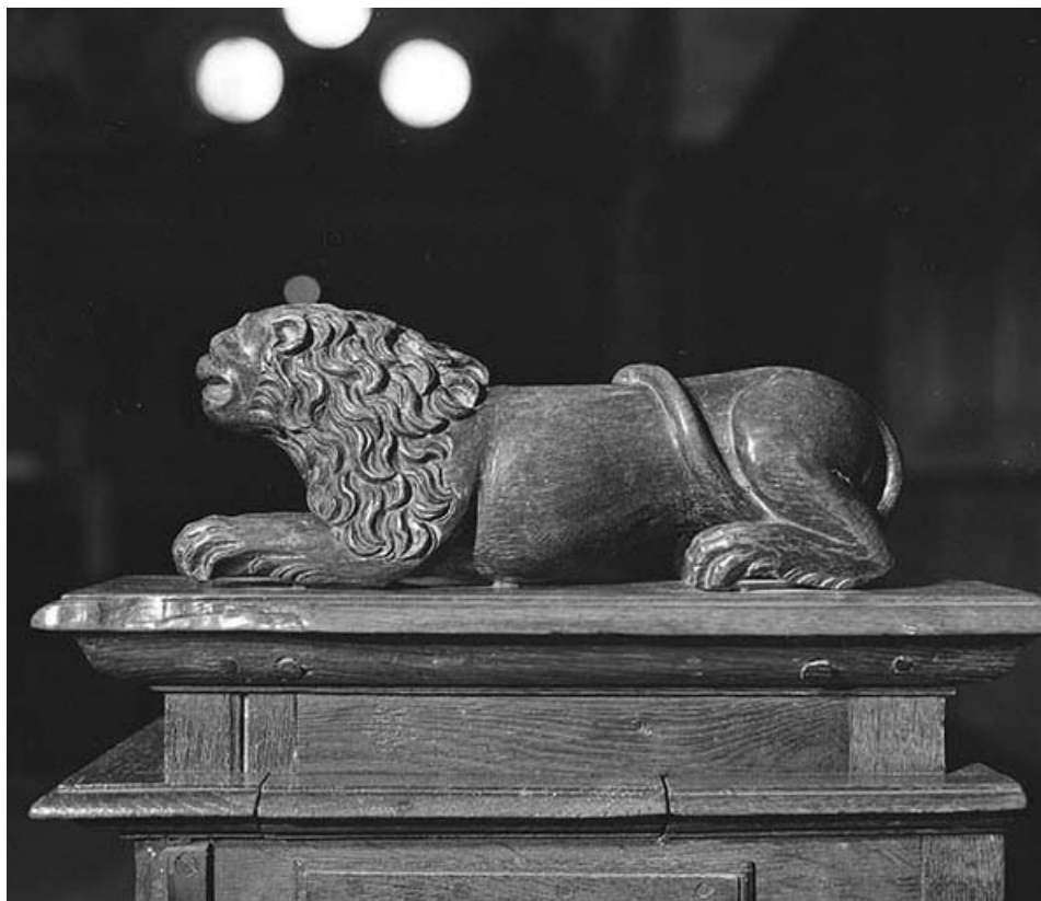
Lion sur une jouée des stalles basses.