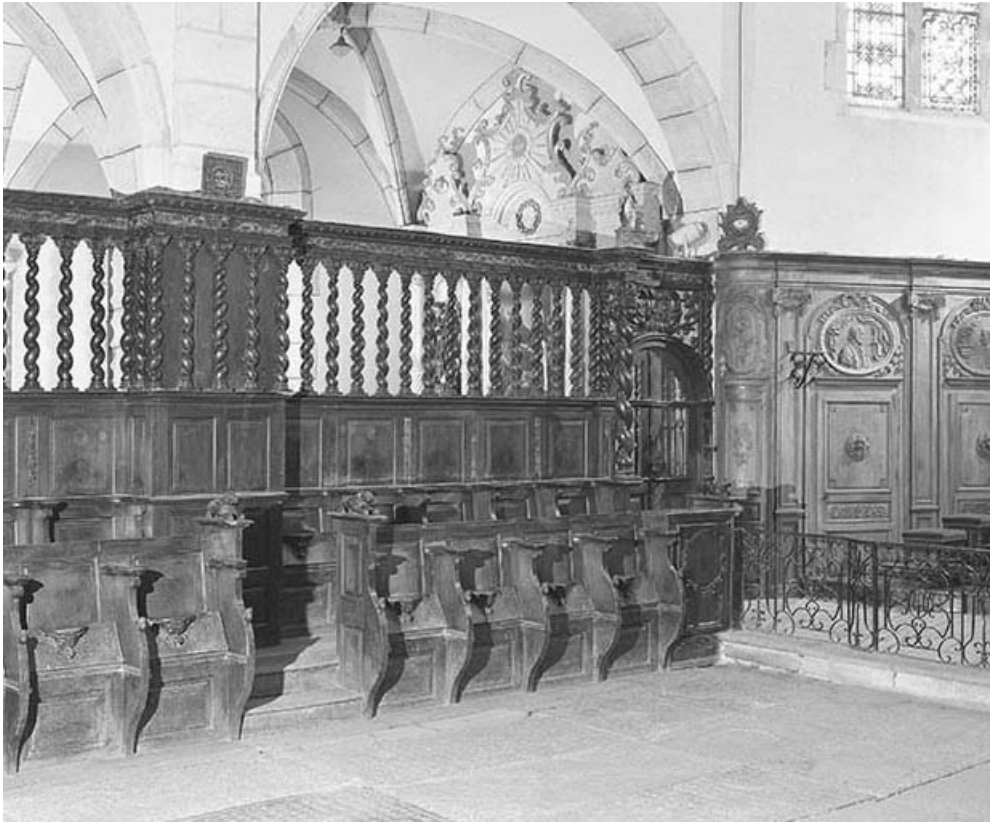
Vue générale des stalles de gauche.