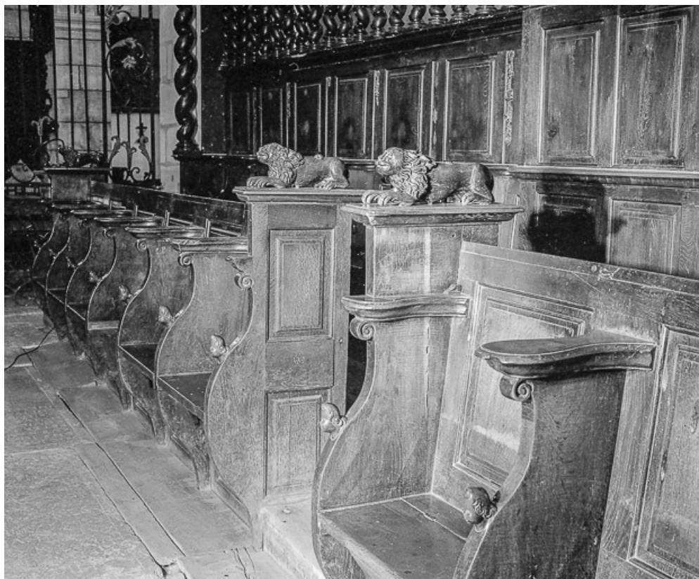
Stalles de la rangée de droite.