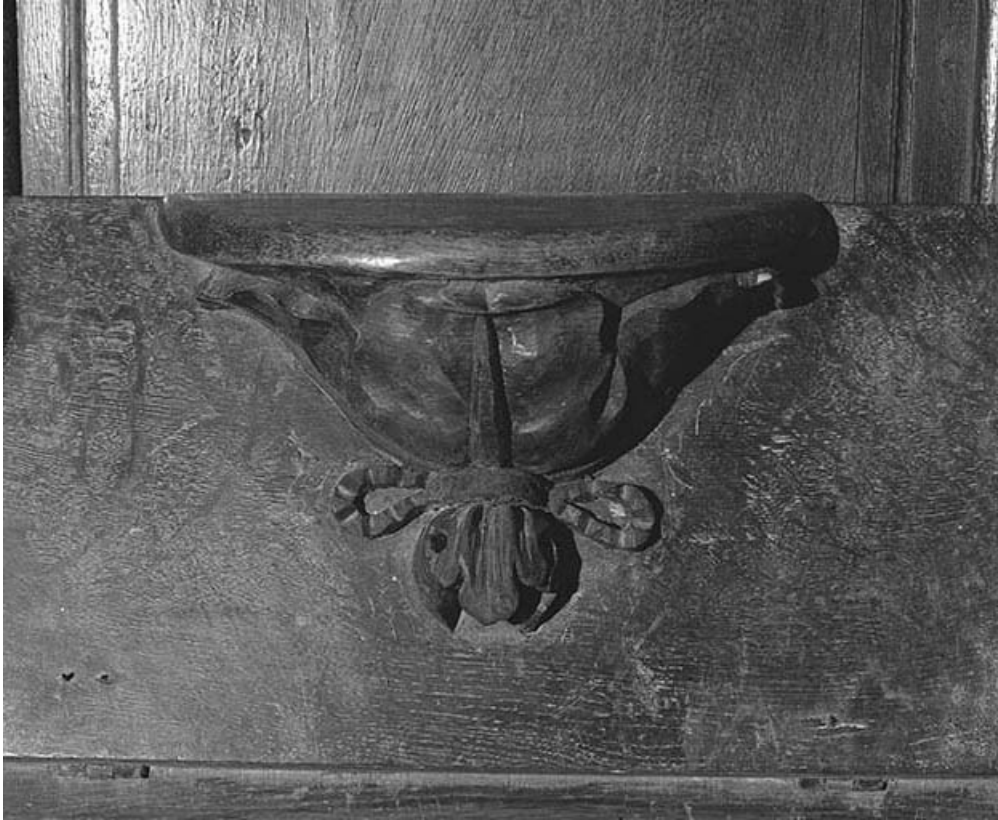
Une miséricorde. 39, Conliège Eglise