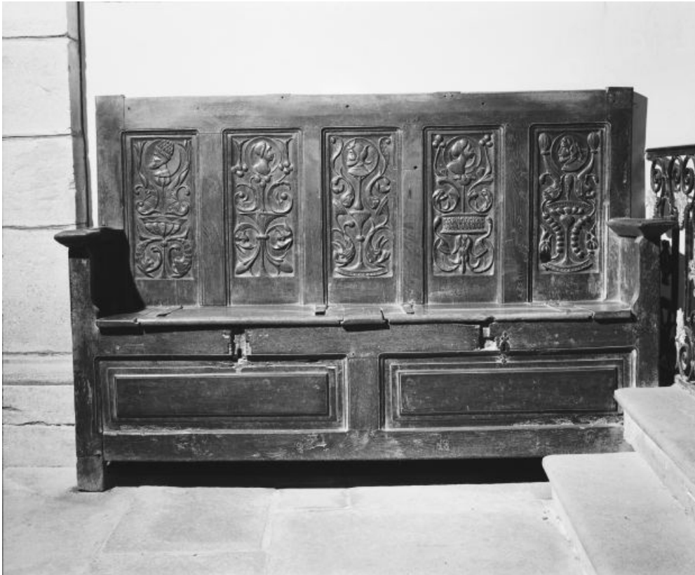
Vue d'ensemble de face.