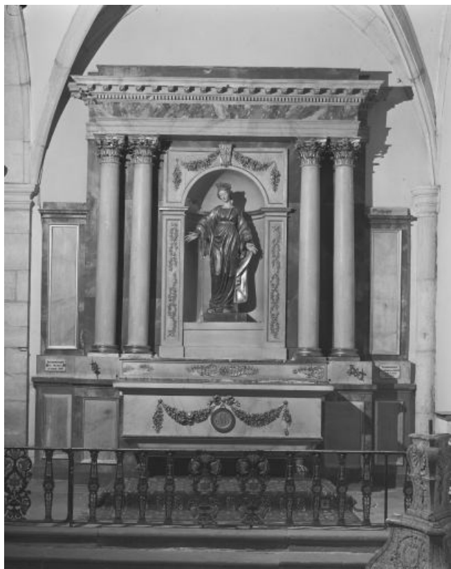
Vue d'ensemble. 39, Conliège Eglise