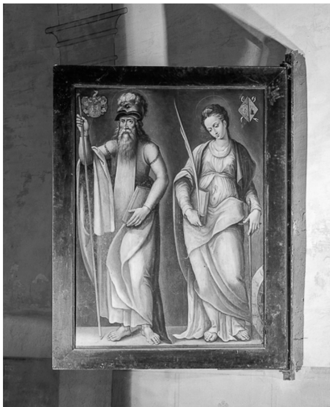
Saint Guillaume et sainte Catherine.