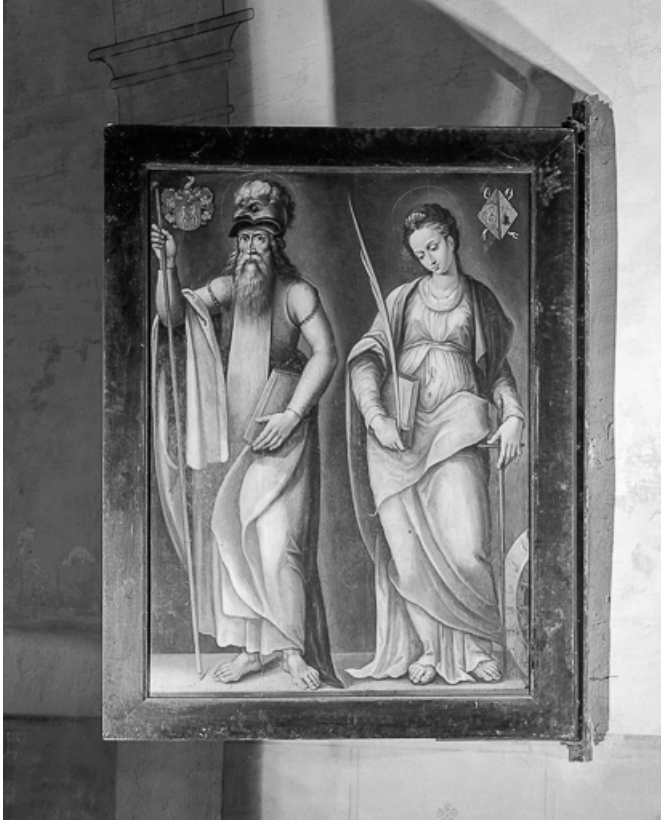
Saint Guillaume et sainte Catherine.