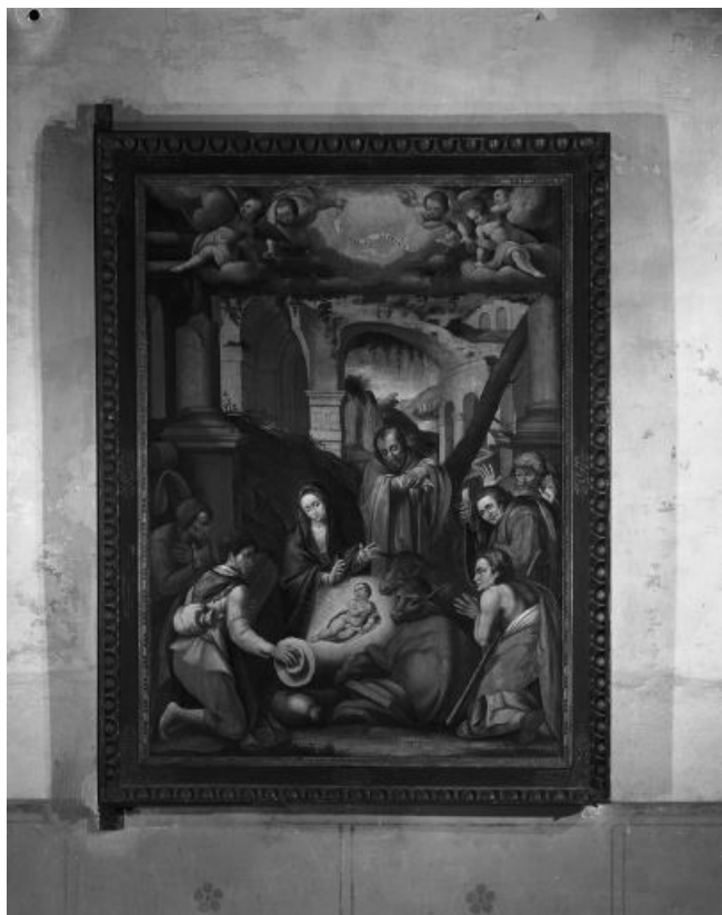
Vue du recto : l'Adoration des bergers. 39, Châtillon