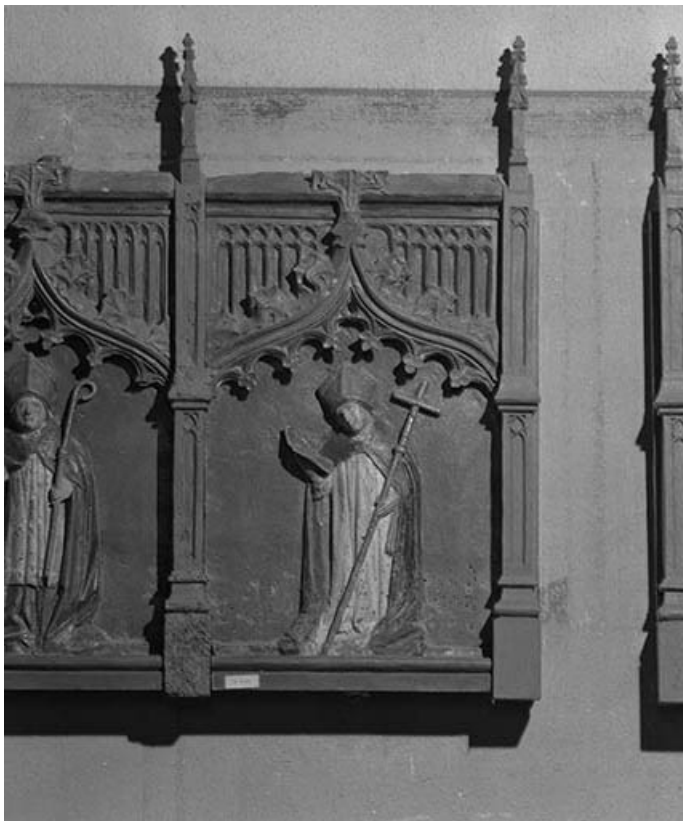
Abbé. 39, Châtillon