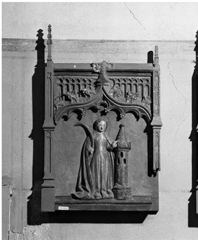
Sainte Barbe. 39, Châtillon