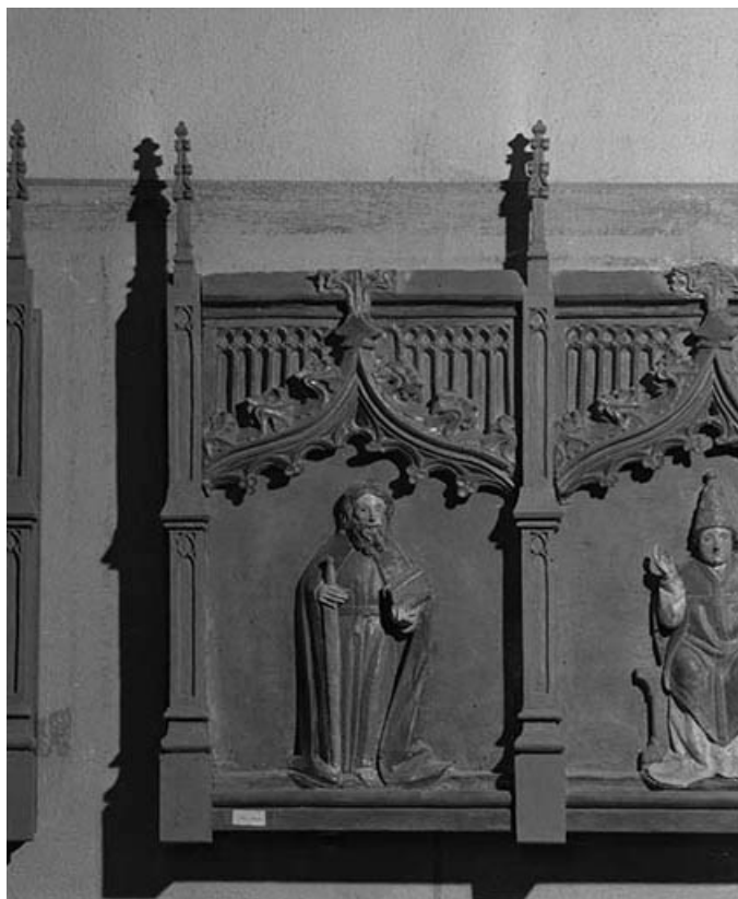
Saint-Paul. 39, Châtillon