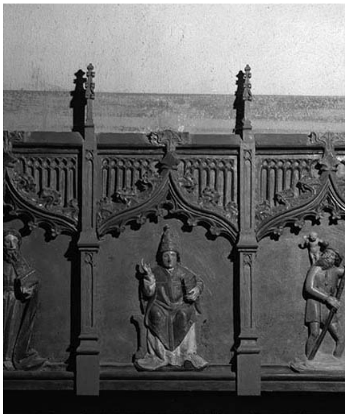
Pape. 39, Châtillon