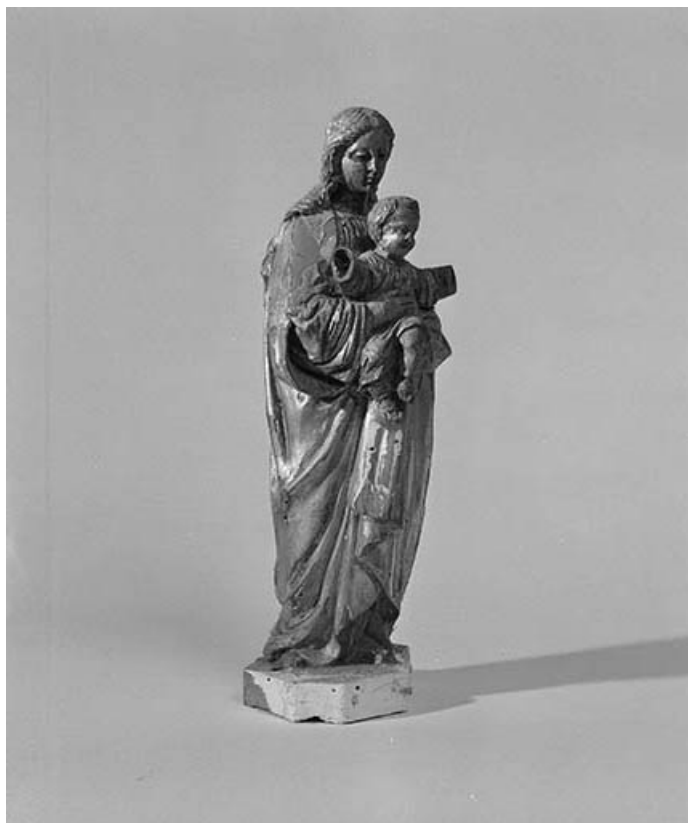
Vue de trois quarts droit.