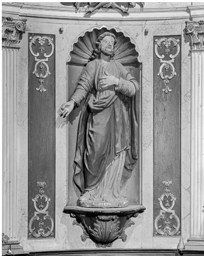
Vue de face de Saint Joseph.