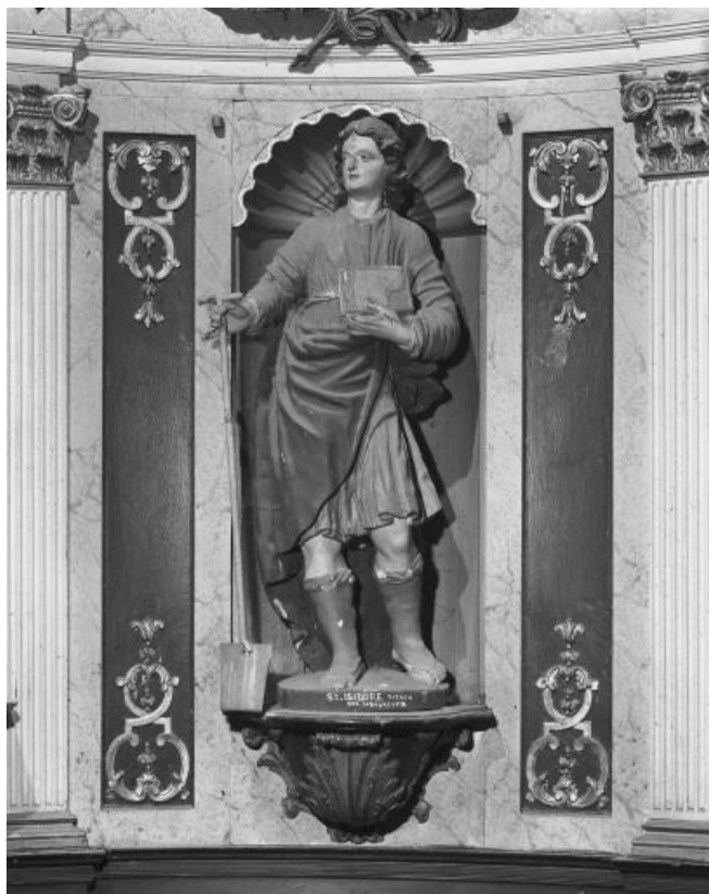
Vue de face de saint Isidore.