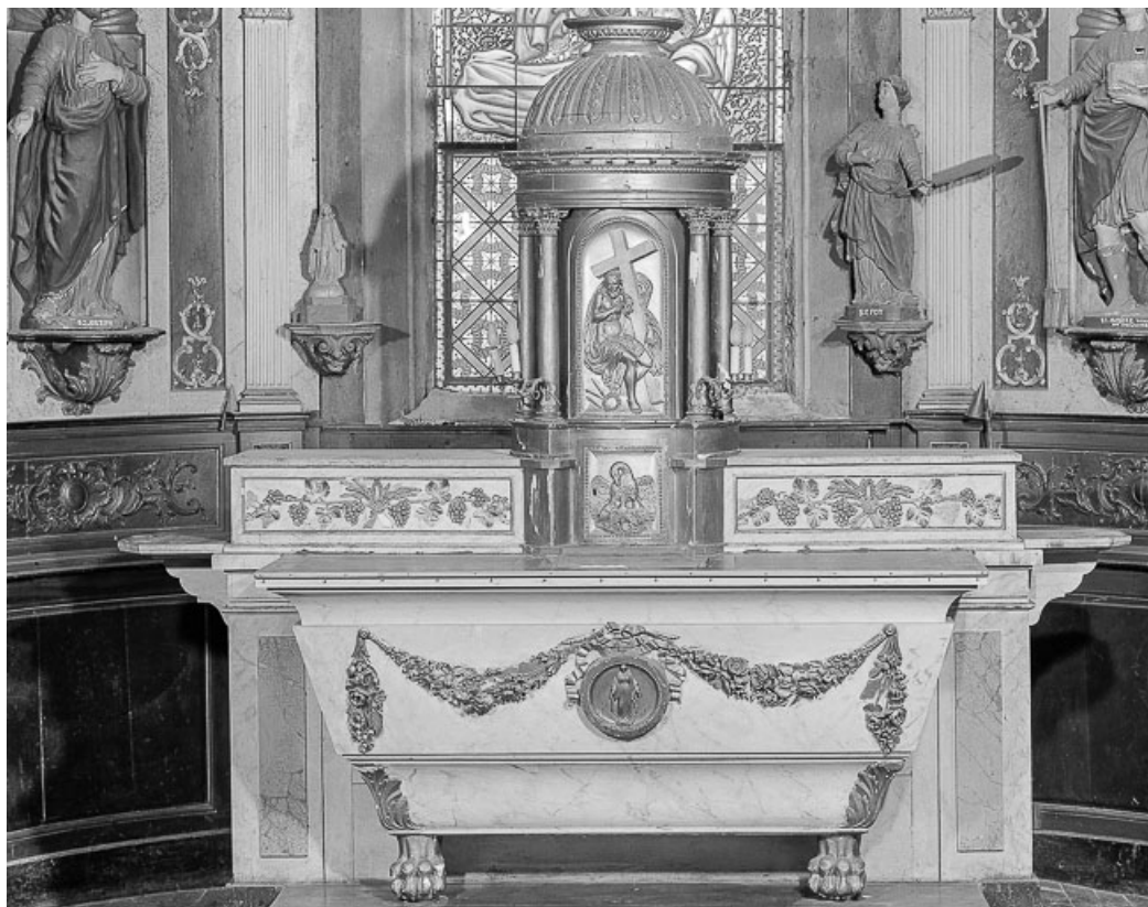
Maître-autel : l'autel.