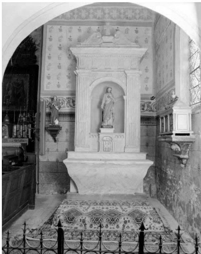
Vue de l'autel-retable latéral sud.