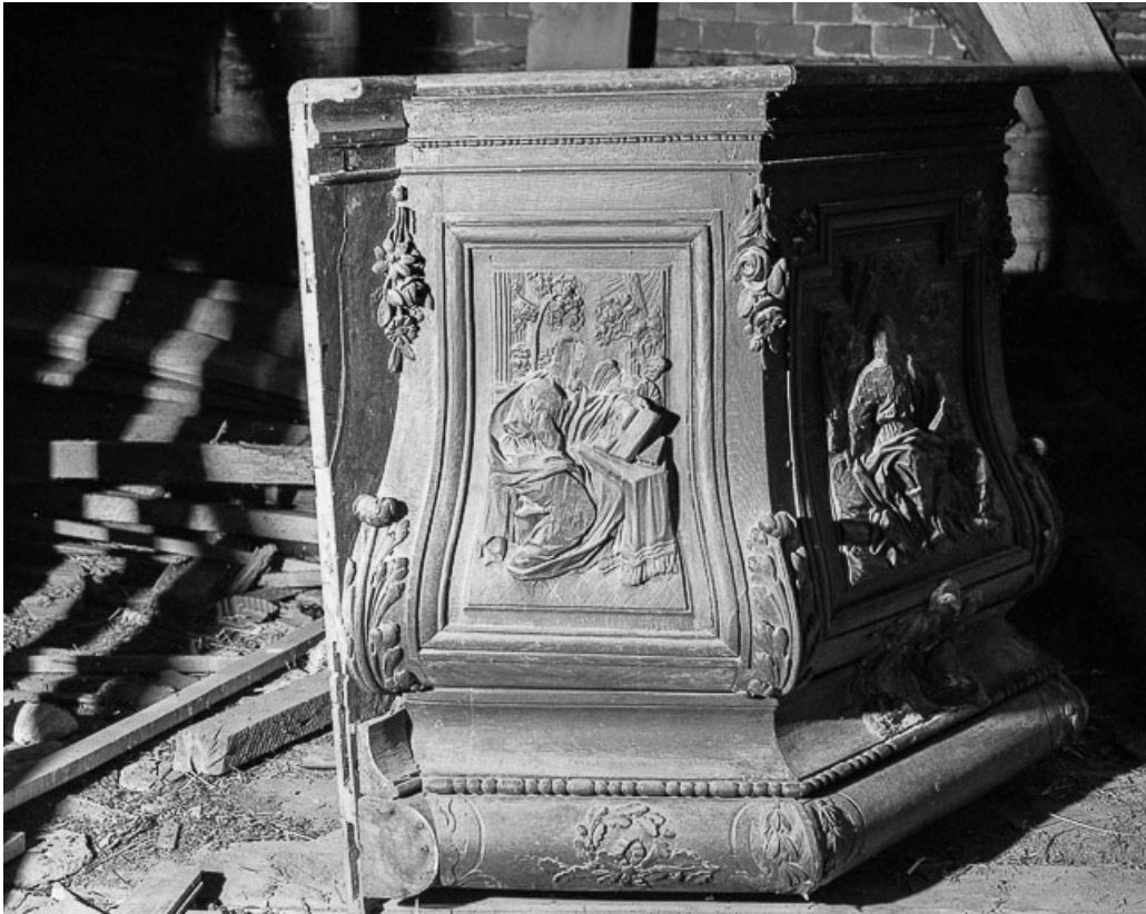
Détail : panneau de la cuve : saint Matthieu. 39, Chapelle-Voland