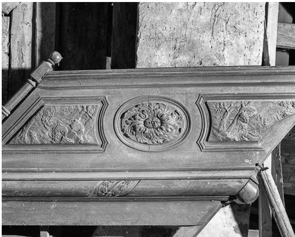
Détail : rampe.