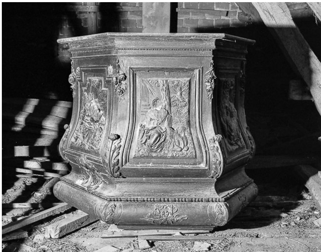
Détail : panneau de la cuve : saint Luc. 39, Chapelle-Voland