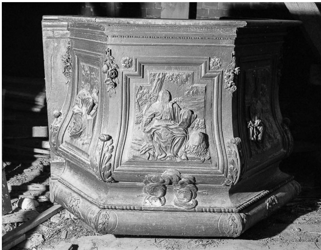
Détail : panneau de la cuve : saint Marc. 39, Chapelle-Voland