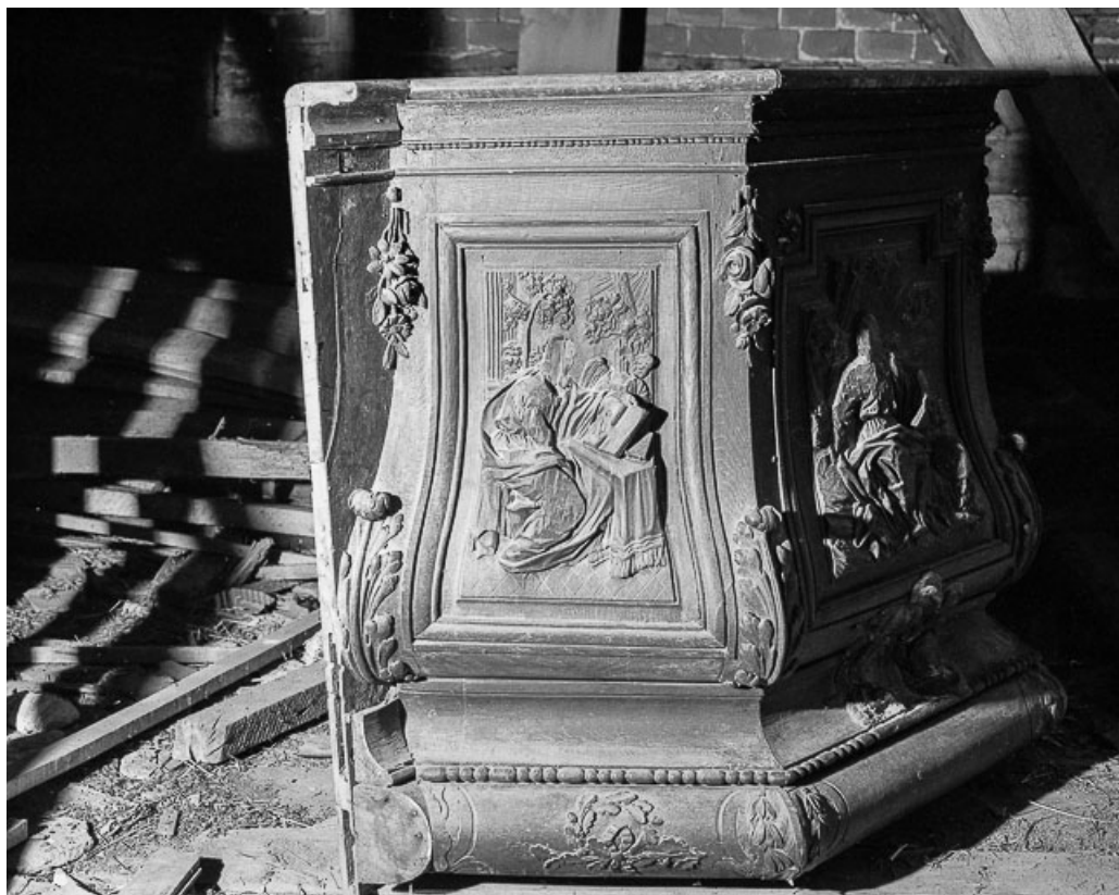
Détail : panneau de la cuve : saint Matthieu.