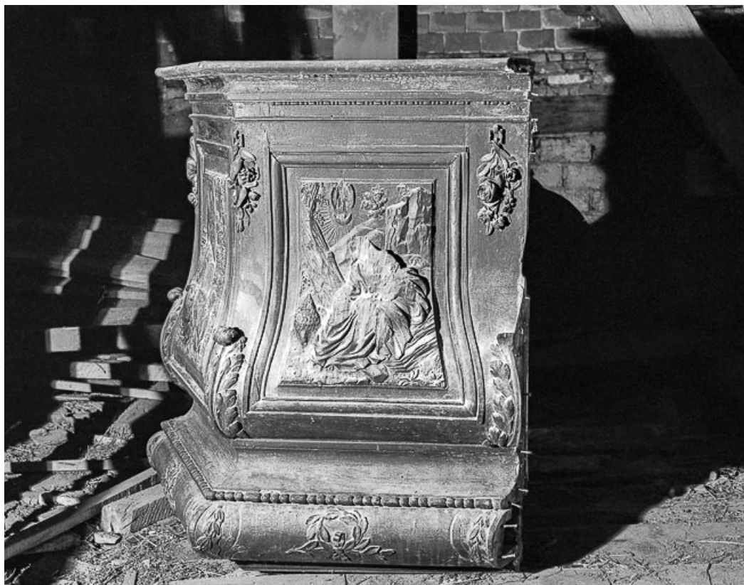
Détail : panneau de la cuve : saint Jean. 39, Chapelle-Voland