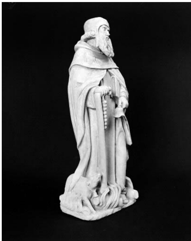
Vue de trois quarts gauche.

39, Arlay place de l' Eglise, lieudit : Arlay-le-Bourg