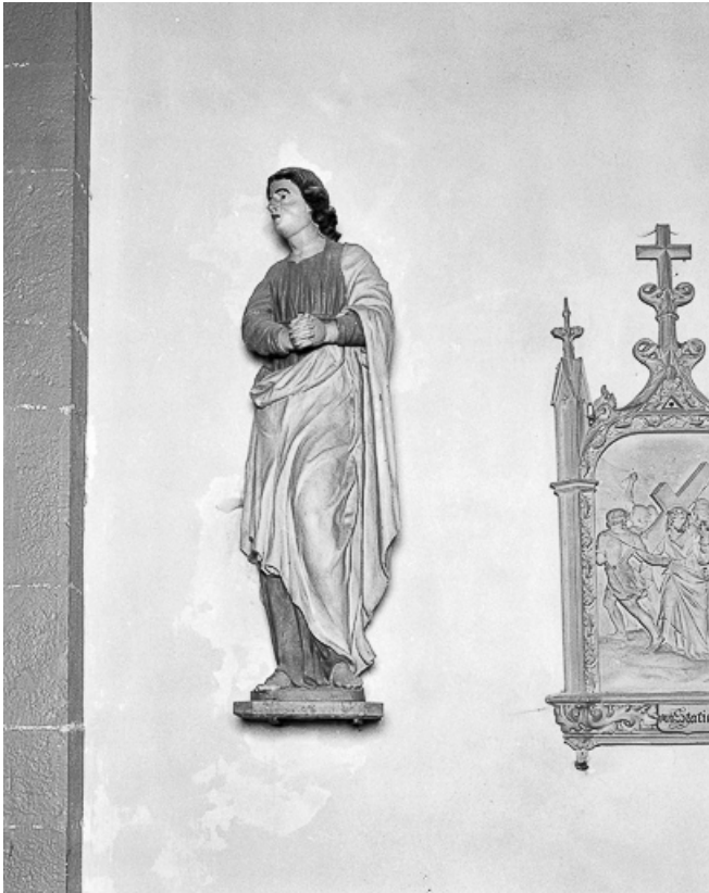
Saint Jean vu de trois quarts gauche.

39, Arlay place de l' Eglise, lieudit : Arlay-le-Bourg