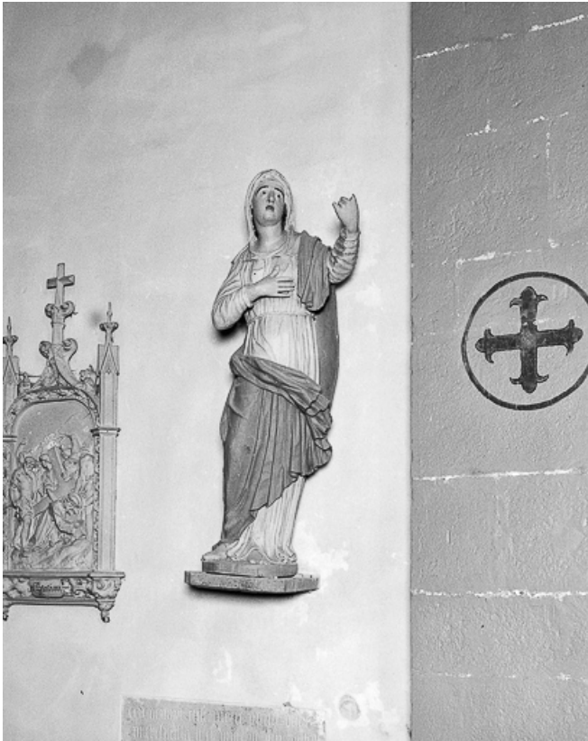
La Vierge vue de face.

39, Arlay place de l' Eglise, lieudit : Arlay-le-Bourg