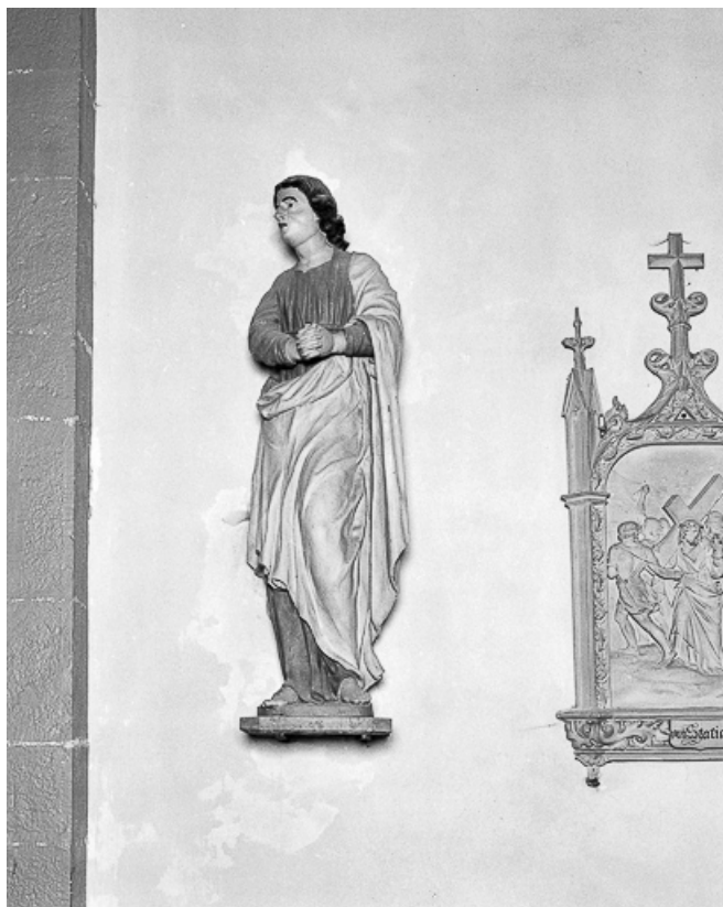
Saint Jean vu de trois quarts gauche.

39, Arlay place de l' Eglise, lieudit : Arlay-le-Bourg