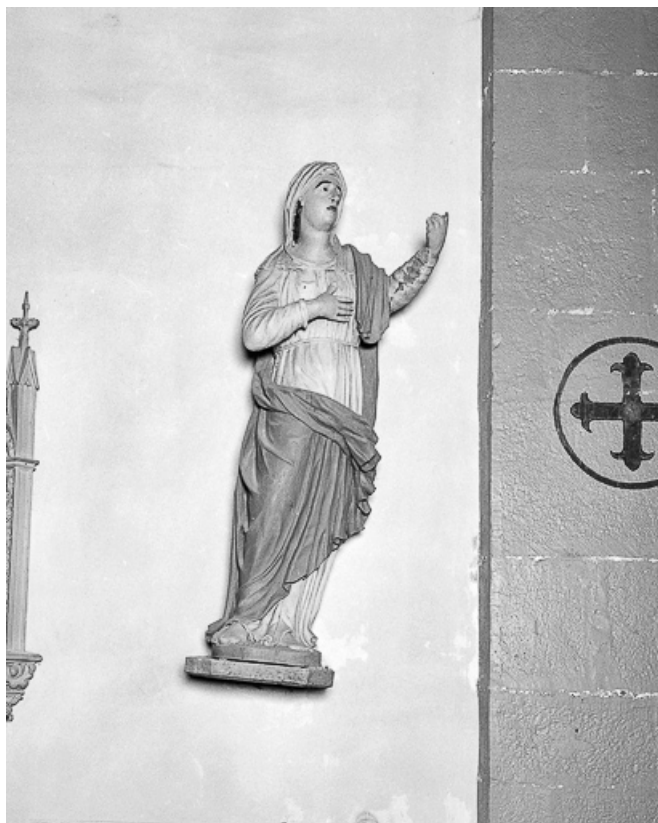
La Vierge vue de trois quarts droit.

39, Arlay place de l' Eglise, lieudit : Arlay-le-Bourg