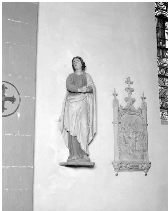
Saint Jean l'Evangeliste vu de face.

39, Arlay place de l' Eglise, lieudit : Arlay-le-Bourg