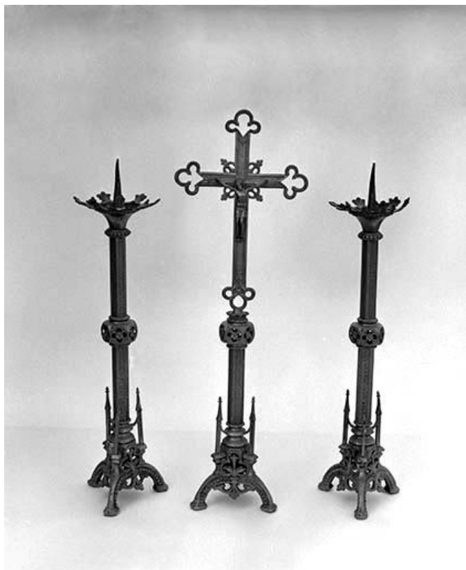
Vue de la croix et de deux chandeliers.