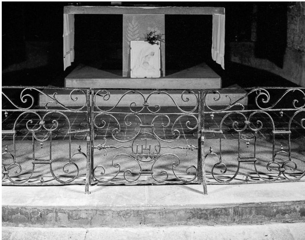
Vue de la partie centrale.