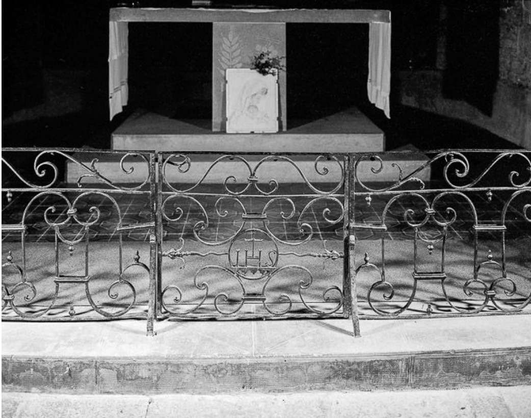
Vue de la partie centrale.