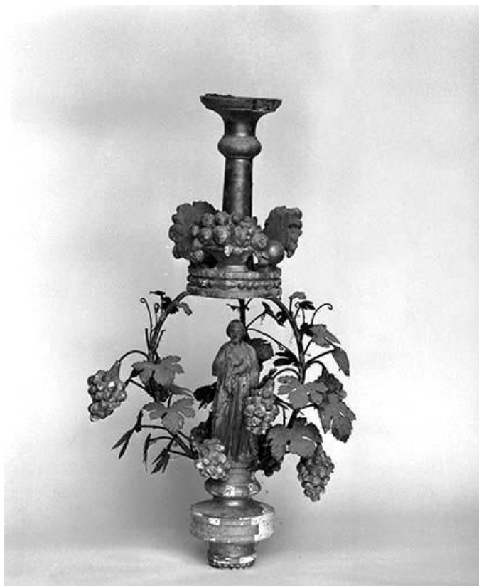
Saint Vincent. 39, Saint-Didier