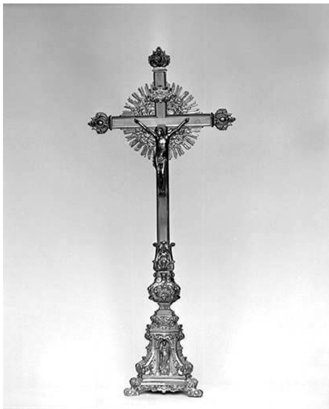
Vue générale. 39, Saint-Didier