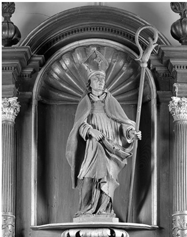
Vue de face.