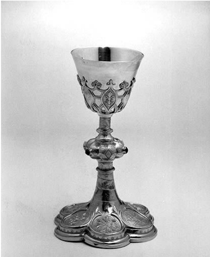
Vue générale. 39, Montmorot