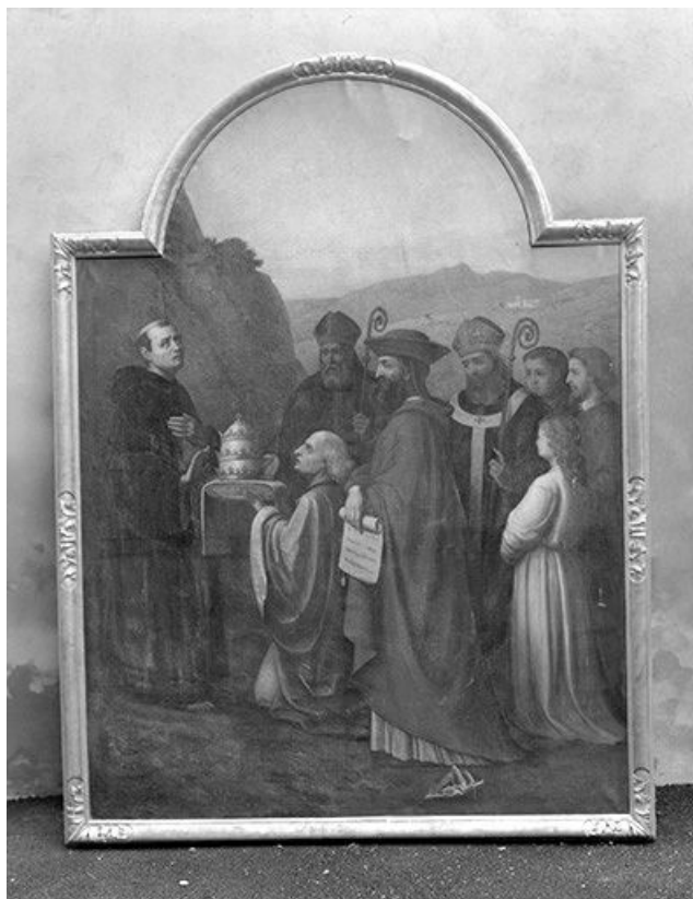
Vue générale. 39, Montmorot