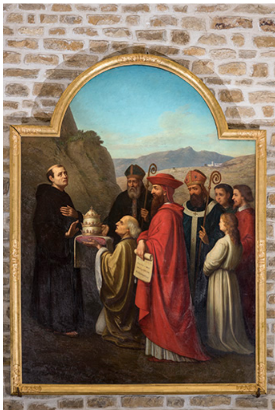
Vue générale. 39, Montmorot