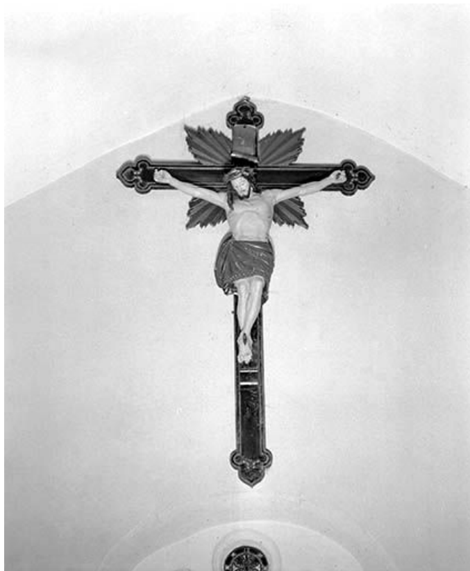
Vue de face.