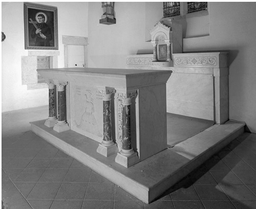
Vue de trois quarts.