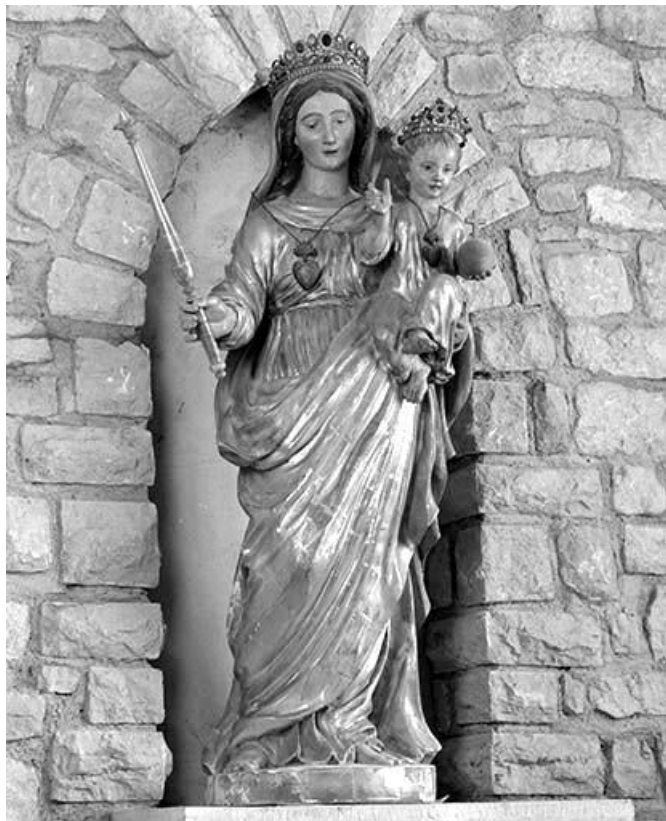
Vue de face. 39, Macornay