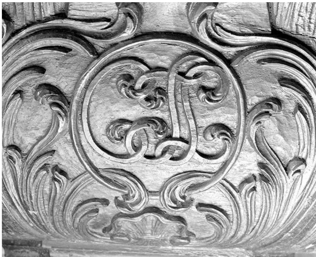
Détail du culot.