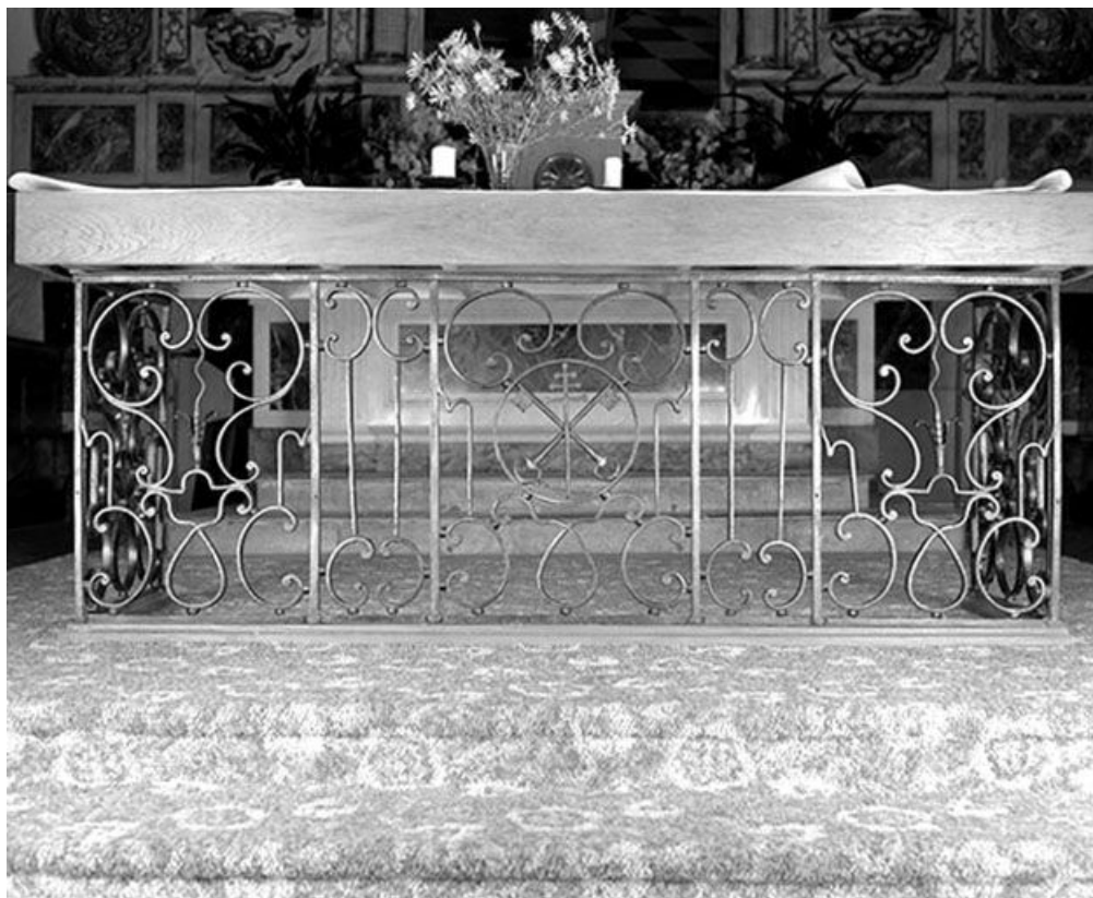
Vue de la partie centrale.