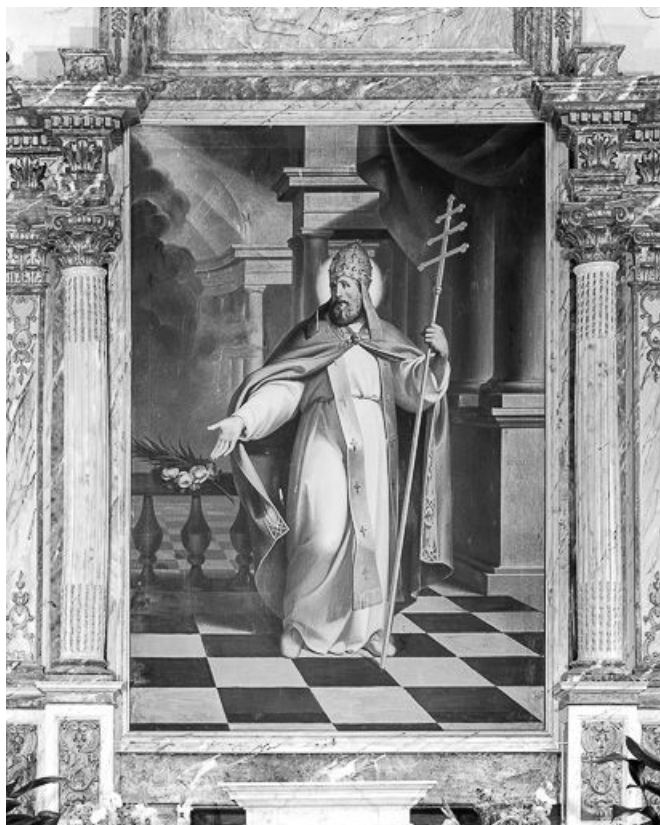
Vue générale. 39, L'Étoile