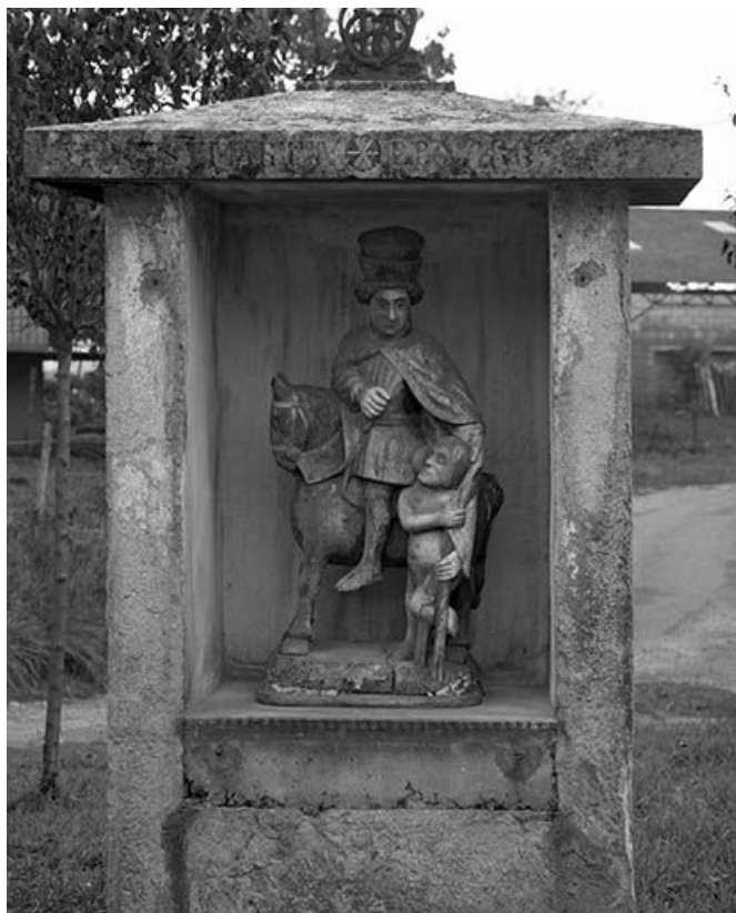
Vue générale dans l'oratoire.

39, Courlaoux route de Condamine, lieudit : Nilly