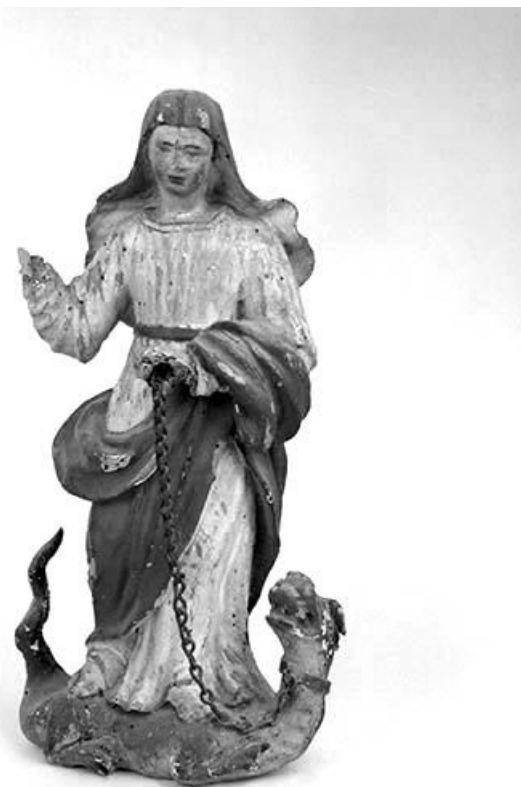
Sainte Marthe. 39, Courlaoux