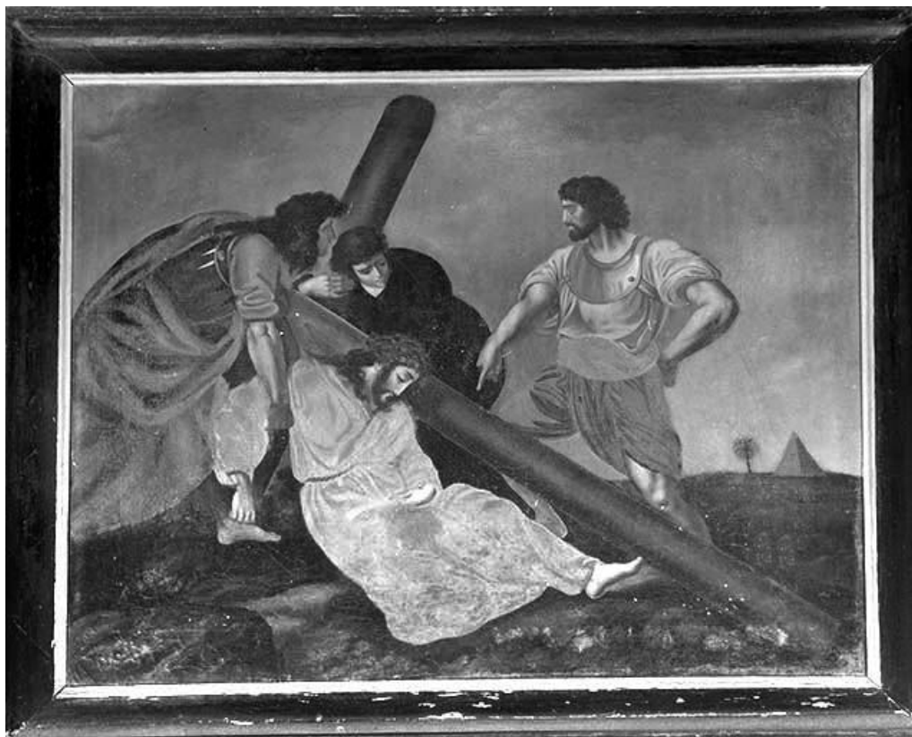
Quatrième station : Jésus tombe pour la première fois.