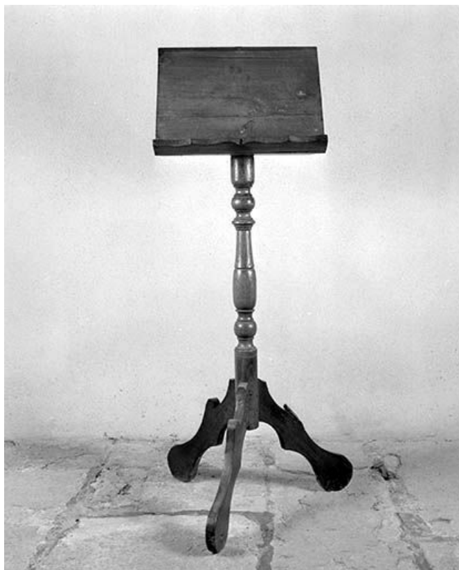
Vue générale de face.