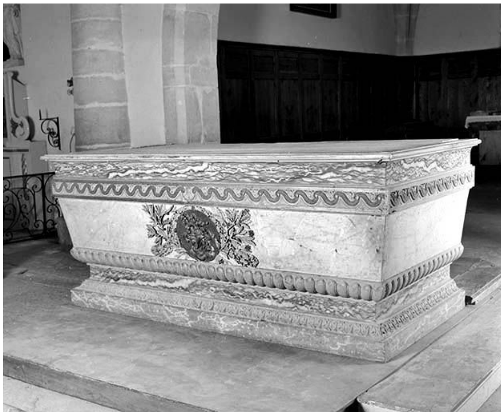
Vue générale de trois quarts.