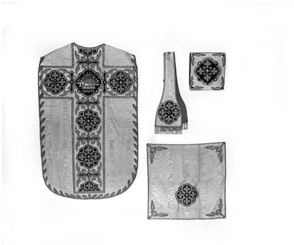
Vue de la chasuble, du manipule, du voile de calice et de la bourse de corporal. 39, Courlaoux