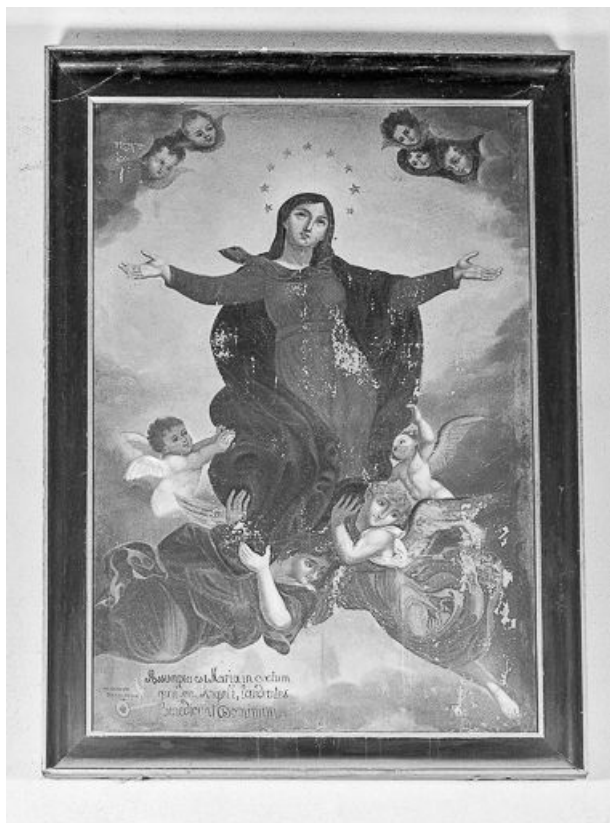
Vue générale. 39, Courlaoux