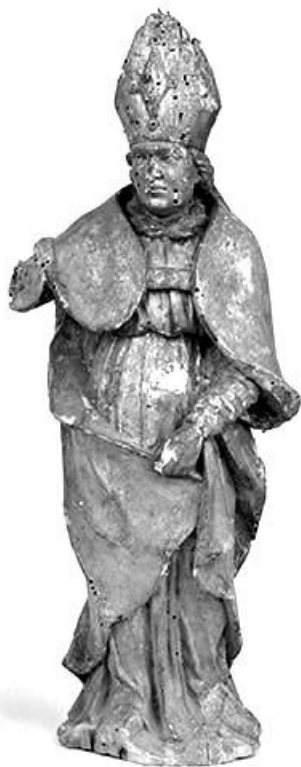
L'évêque vu de face.