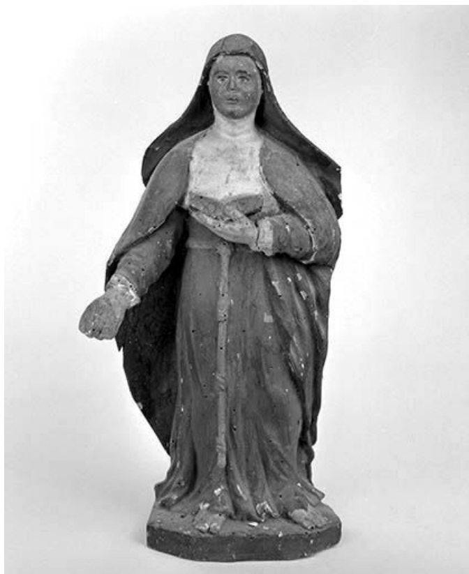
Religieuse : sainte Claire ?