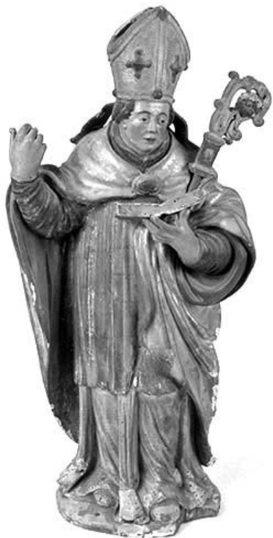
Vue de face. 39, Courlans