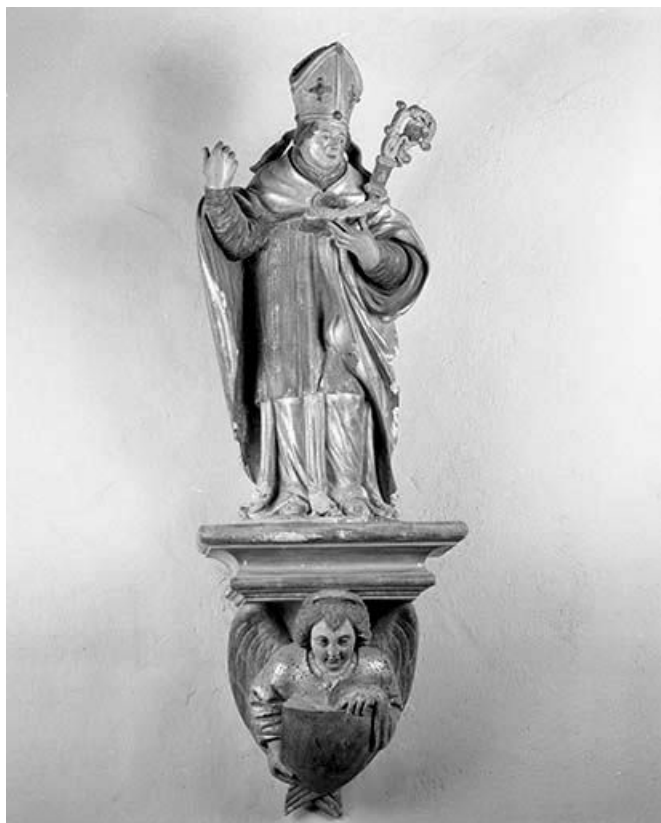
Vue de face avec la console.